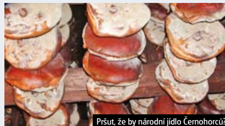
Pršut, že by národní jídlo Černohorců?

Žádejte informace v CK nebo na www.geops.cz