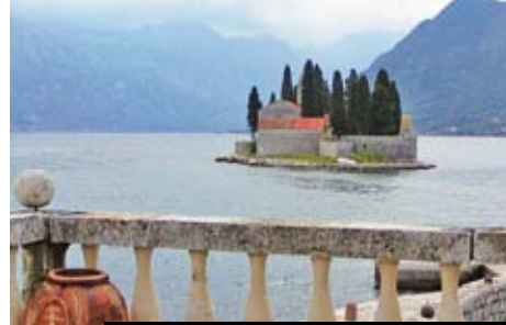
Tajemný lodní výlet k ostrůvku Gospa s kostelíčkem