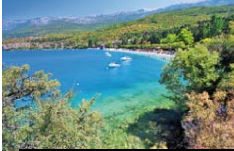
Makedonie nejsou jen romantické hory, ale i útulné pláže