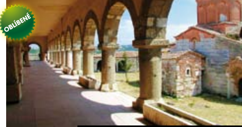
Jeden z řady románských klášterů v Albánii