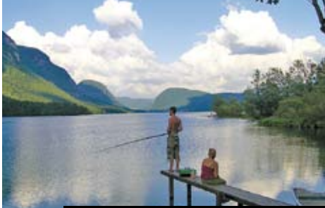
Rybaření na Bohynjském jezeře v Julských Alpách