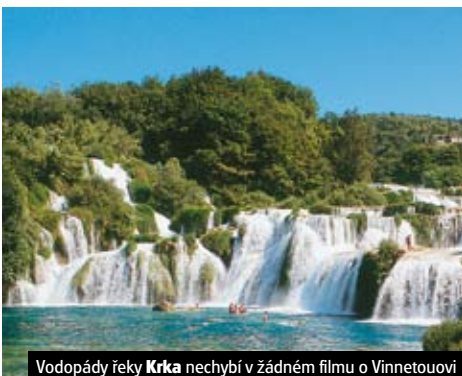
Vodopády řeky Krka nechybí v žádném filmu o Vinnetuovi

Cena zahrnuje: dopravu autobusem, 7x hotel (2l. pokoje), 2x tur. hotel/apartmánové domy, 9x polopenzí, vedoucí zájezdu, komplexní pojištění; nezahrnuje vstupné, fakult. akce a místní doprava (80 €).