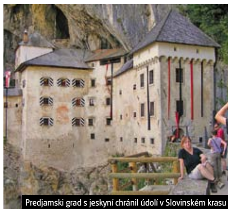
Predjamský grad s jeskyní chránil údolí v Slovinském krasu