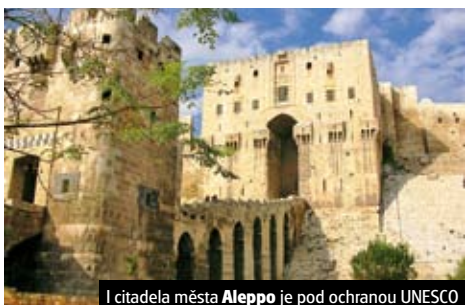
Citadela města Aleppo je pod ochranou UNESCO

Celková cena zájezdu vč. letišt. a bezpeč. taxje 26.790 Kč ke dni tisku katalogu.