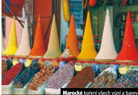
Marocké koření všech vůní a barev