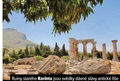
Ruiny starého Korintu jsou svědky dávné slávy antické říše

Celková cena zájezdu vč. letišt. a bezpeč. taxje 38.190 Kč ke dni tisku katalogu.