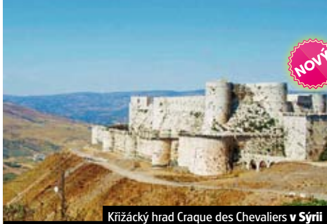
Křižácký hrad Craque des Chevaliers v Sýrii