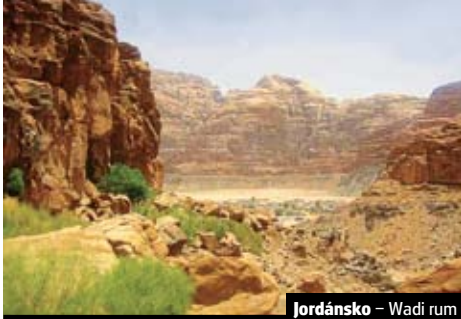
Jordánsko – Wadi rum