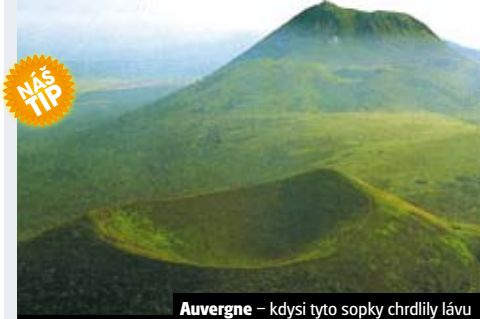
Auvergne – kdysi tyto sopky chrdlily lávu