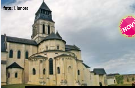
Královské opatství Abbaye de Fontevraud UNESCO

Celková cena zájezdu vč. letišt. a bezpeč. tax je 13.890 Kč ke dni tisku katalogu.