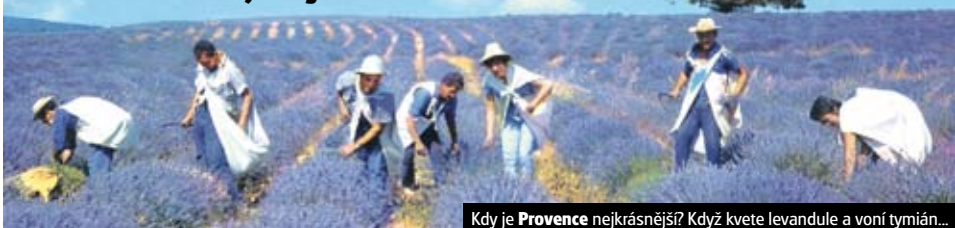
Kdy je Provence nejkrásnější? Když kvete levandule a voní tymián...