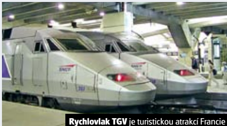
Rychlovlak TGV je turistickou atrakcí Francie

Příplatek 980 Kč/studenti 700 Kč za jízdenku TGV.