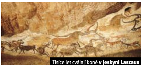
Tisíce let cválají koně v jeskyni Lascaux