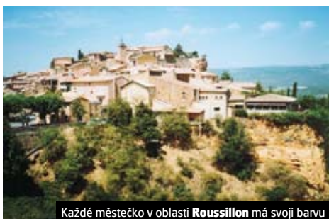
Každé městečko v oblasti Roussillon má svoji barvu