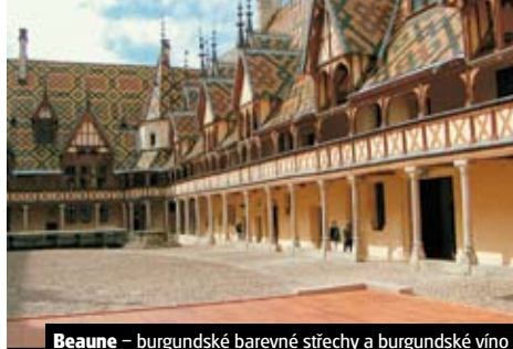
Beaune – burgundské barevné střechy a burgundské víno