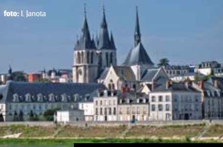
Starobylé sídlo vévodů Orleánských v Blois