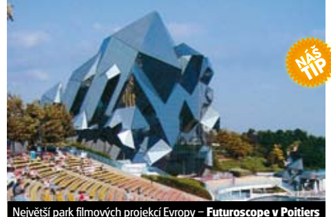
Největší park filmových projekcí Evropy – Futuroscope v Poitiers

Celková cena zájezdu vč. letiště a bezpeč. tax je 16.490 Kč ke dni tisku katalogu.