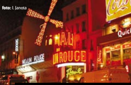
Chloubka čtvrti Montmartre – legendární Moulin Rouge