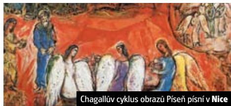
Chagallův cyklus obrazů Píseň písní v Nice