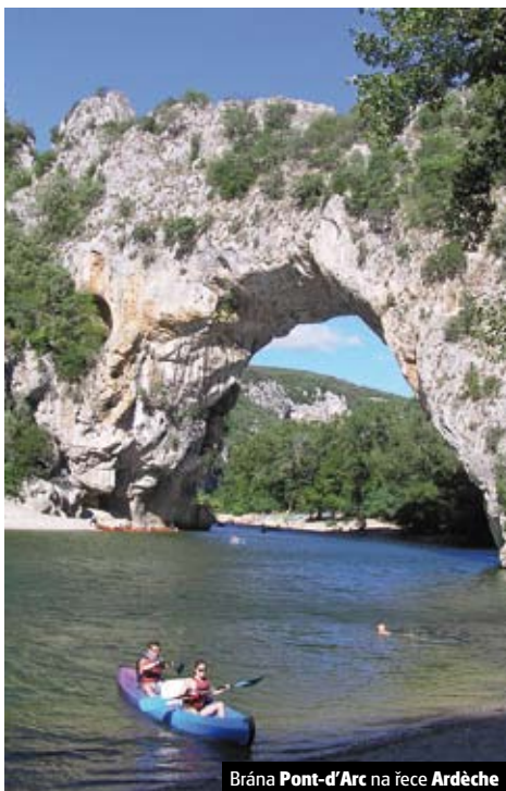
Brána Pont-d'Arc na řece Ardèche