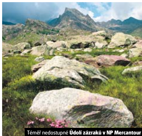
Téměř nedostupné Údolí zázraků v NP Mercantour