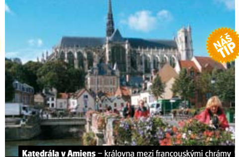
Katedrála v Amiens – královna mezi francouzskými chrámy