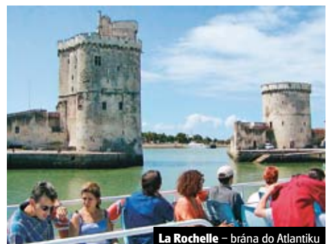
La Rochelle – brána do Atlantiku