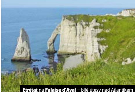
Etrétat na Falaise d'Aval – bílé útesy nad Atlantikem