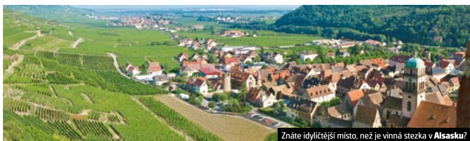
Znáte idyličtější místo, než je vinná stezka v Alsasku?