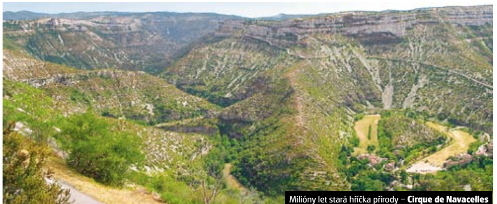
Milióny let stará hříčka přírody – Cirque de Navacelles

6denní zájezd pro studenstvé kolektivy za uměním, koupáním a turistikou na Azurovém pobřeží v ceně od 5.990 Kč