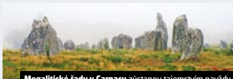
Megalitické řady v Carnacu zůstanou tajemstvím navždy

6denní zájezd do Bretaně a Chartres 1.–2. den: Champagne, krajem vinic : vesnických románských kostelíků, FAUX DE VERZY, pohádkový les, REMEŠ , centrum kraje Champagne 3.–4. den: katedrála v CHARTRES , městečko VITRÉ, dolmen la Roche-aux-Fées, CARNAC, centrum megalitické kultury, QUIMPER, mys Pointe du Raz 5.–6. den: klášter MONT-ST-MICHEL , odpolední a večerní PARÍŽ , památky a muzea Cena zahrnuje dopravu autobusem, 3x hotel (2lůž. pokoj), průvodce, komplexní pojištění; nezahrnuje vstupné do objektů a večeří (40 €). Cena od 7.490 Kč pro 40 osob.