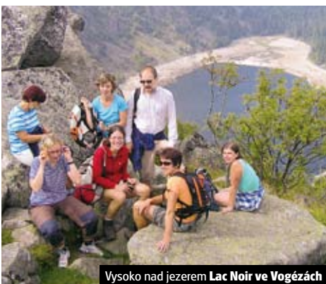
Vysoko nad jezerem Lac Noir ve Vogézách

Alsasko a Schwarzwald, kraj lesů a vína 6tídení zájezd do Francie a Německa za vínem a kouzelnou přírodou. | 1.7.–6.7. | čt–út | 6.290,- | 01-268 | Podrobnosti zájezd A129, str. 35, nebo na www.geops.cz