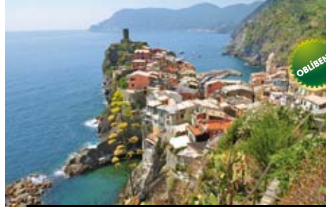
Horské vesničky Cinque Terre si ochranu UNESCO zaslouží