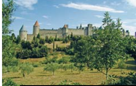
Carcassonne a katarské hrady – chloubou Languedocu