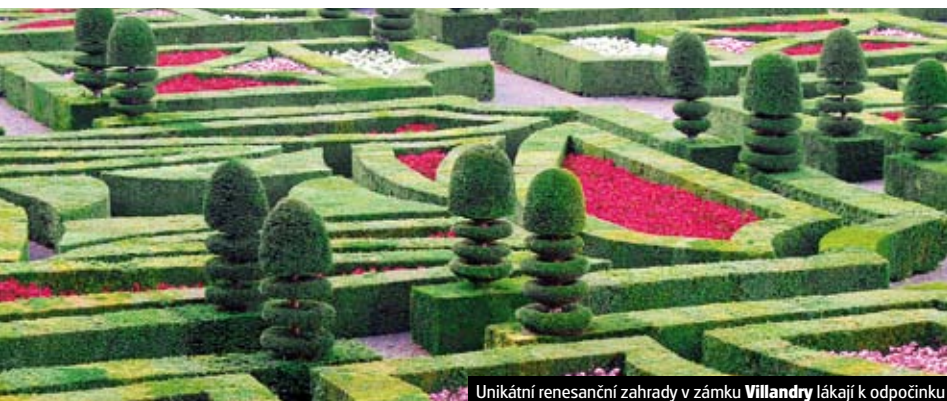
Unikátní renesanční zahrady v zámku Villandry lákají k odpočinku

Celková cena v term. od 9.12. vč. letišt. a bezpeč. tax je 12.980 Kč ke dni tisku katalogu.