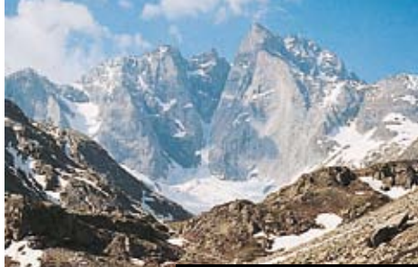
Ostré štíty srdce Pyrenejí Vignemale