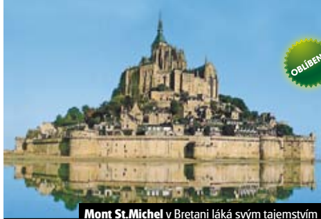
Mont St. Michel v Bretani láká svým tajemstvím