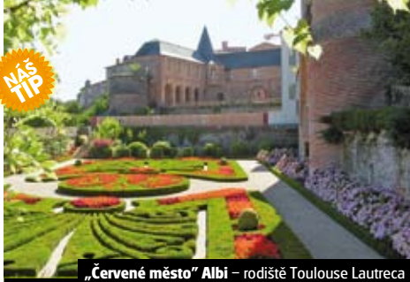
„Červené město“ Albi – rodiště Toulouse Lautreca