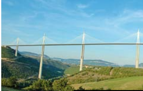
Zákrak století - most u Millau