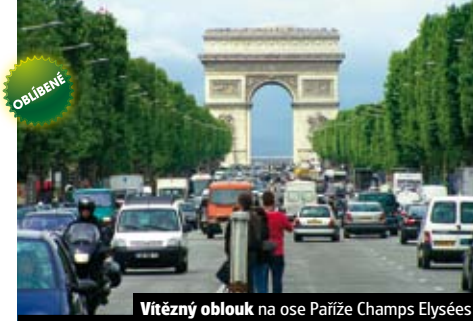
Vítězný oblouk na ose Paříže Champs Elysées