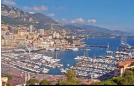
Monaco a Monte Carlo skoro z ptáčích perspektivy