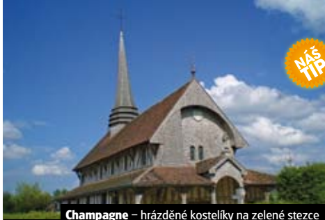
Champagne – hrázděné kostelíky na zelené stezce