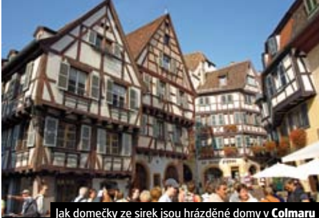
Jak domečky ze sirek jsou hrázděné domy v Colmaru