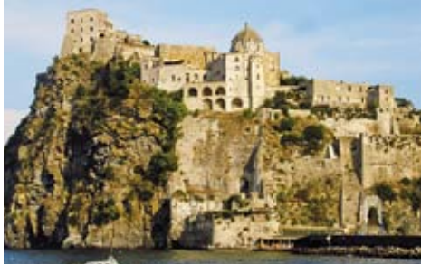
Aragonský hrad střeží ostrov termálů Ischia