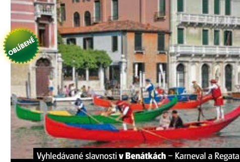
Vyhledávané slavnosti v Benátkách – Karneval a Regata