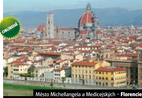
Město Michelangela a Medicejských – Florencie