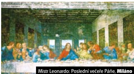
Mistr Leonardo: Poslední večeře Páně, Miláno