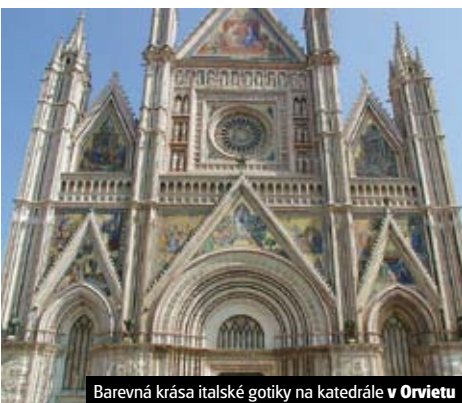
Barevná krása italské gotiky na katedrále v Orvietu

5denní tematický zájezd na Ligurskou riviéru, za uměleckými skvosty Milána, Leonardovou freskou Poslední večere, na zámek Stupigni a vesnici Cinque Terre s turistikou a koupáním. Cena od 5.990 Kč pro kolektiv 40 osob.