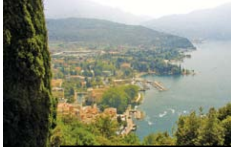
Díváte se na severní cíp jezera Lago del Garda