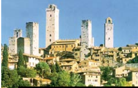
San Gimignano má zachovalých rodových věží nejvíce