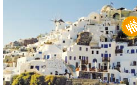
Ostrov Santorini – možná bájná Atlantída

Cena zahrnuje zpáteční letenku, let. a bezpeč. taxy (cca 3.000 Kč), lístek na veřejnou hromadnou dopravu na 6 dnů, 7x hotel s venkovním bazénem (2lůžkové pokoje), 7x snídaně, průvodce; nezahrnuje léčeb. pojištění a vstupné (70 €). Příplatek 1.400 Kč 6x večeře, 224 Kč za kompl. pojištění.