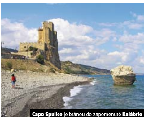
Capo Spulico je bránou do zapomenuté Kalábrie