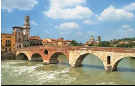
Ponte Pietra, jeden z mostů, který vás přivede do centra Verony