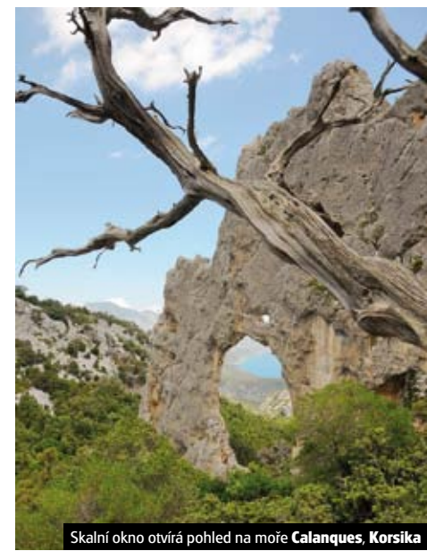
Skalní okno otvírá pohled na moře Calanques, Korsika

Pobytové zájezdy na západním pobřeží Korsiky s bohatými výlety a každodenní turistikou po ostrově (viz str. 62).