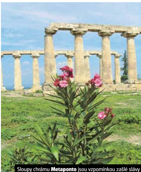
Sloupy chrámu Metaponto jsou vzpomínkou zašlé slávy