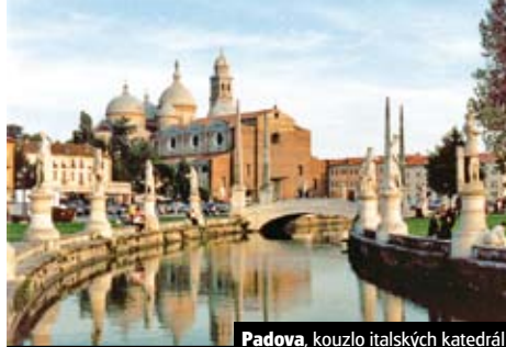
Padova, kouzlo italských katedrál