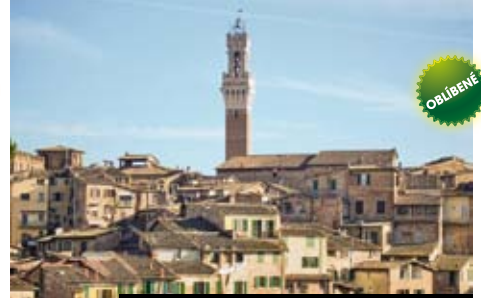
Víte že má Siena nejkrásnější náměstí na světě?