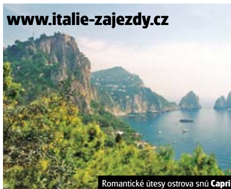
Romantické útesy ostrova snů Capri