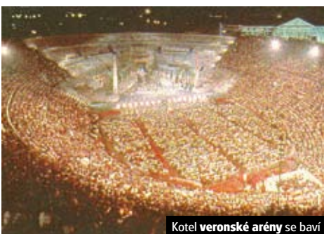
Kotel veronské arény se baví