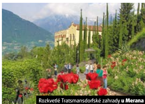
Rozkvetlé Tratsmansdorfské zahrady u Merana

Cena zahrnuje dopravu autobusem, 2x hotel (2lůžkové pokoje), 2x snídaně, průvodce, komplexní pojištění; nezahrnuje vstupné a fakul. akce (45 €). Příplatek 780 Kč 2x večere (3 chody).