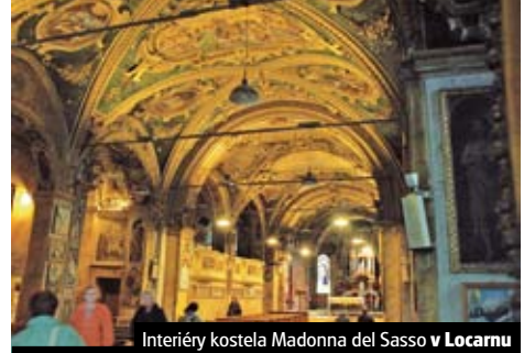
Interiéry kostela Madonna del Sasso v Locarnu