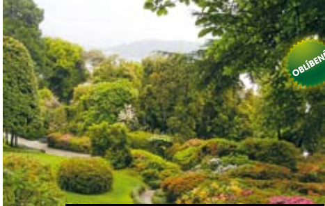
Tremezzo – zahrada vily Carlotta. No není krásná?