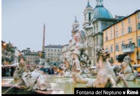
Fontana del Neptuno v Římě