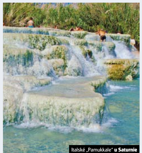
Italské „Pamukkale“ u Saturnie