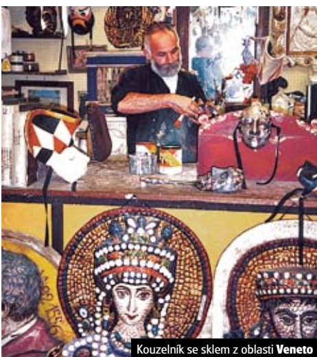
Kouzelník se sklem v oblasti Veneto

Zájezdy pro kolektivy za historií a památkami Itálie Tematické zájezdy pro zájmové skupiny a studenty po celé Itálii spojené s exkurzemi, návštěvami aktuálních výstav, gastronomickými ochutnávkami, cestami za památkami UNESCO, s turistikou a koupáním na plážích Itálie. WWW.KOLEKTIVY.CZ