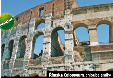
Římské Colosseum, chloubka antiky