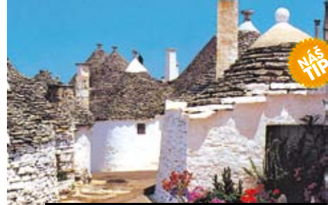
Jako z pohádky působí bílé domky vesnice Alberobello