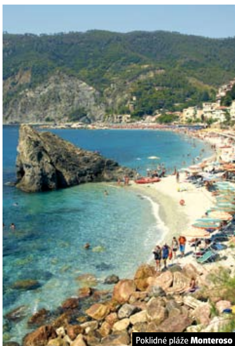
Poklidné pláže Monteroso