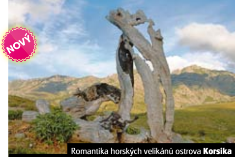
Romantika horských velikánů ostrova Korsika