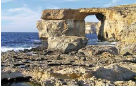
Kamenné okno na ostrově Gozo