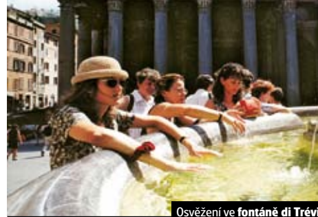
Osvěžení ve fontáně di Trevi