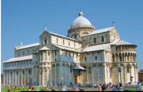
Krása v krajoví – katedrály, věže i composanta v Pise