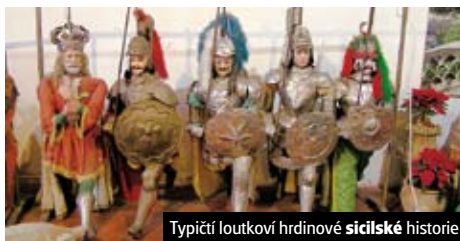
Typičtí loutkoví hrdinové sicilské historie

Podrobnosti a program zájezdu D15 na stránce 63.