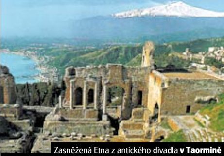
Zasněžená Etna s antického divadla v Taormině