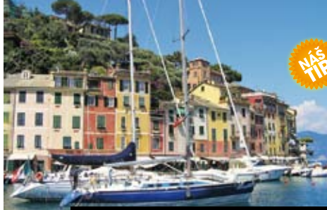
Utajená městečka Cinque Terre – chlouba Ligurie