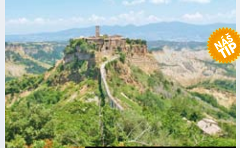
Pohádková města etruského kraje Lazio