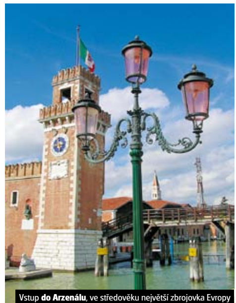
Vstup do Arzenálu, ve středověku největší zbrojovka Evropy