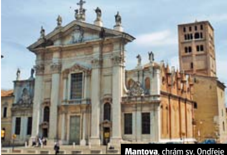
Mantova, chrám sv. Ondřeje