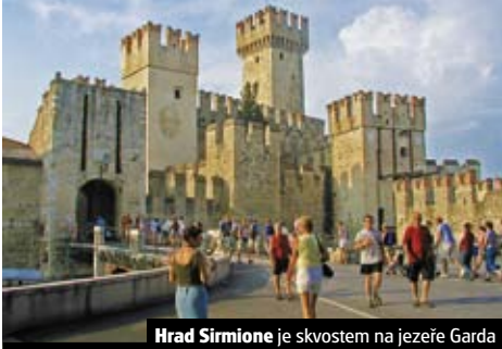
Hrad Sirmione je skvostem na jezeře Garda