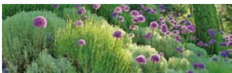
Rozkvetlé Tratsmansdorfské zahrady u Merana