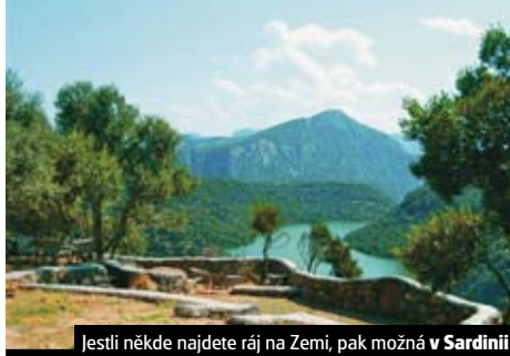
Jestli někde najdete ráj na Zemi, pak možná v Sardinii