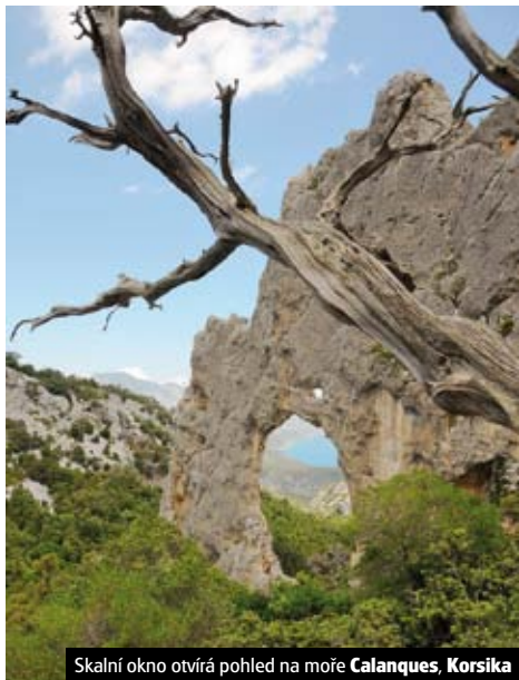
Skalní okno otvírá pohled na moře Calanques, Korsika

Pobytové zájezdy na západním pobřeží Korsiky s bohatými výlety a každodenní turistikou po ostrově (viz str. 62).