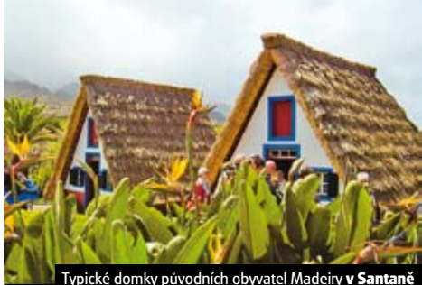
Typické domky původních obyvatel Madeiry v Santaně