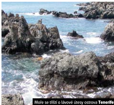
Moře se tříští o lávové útesy ostrova Tenerife