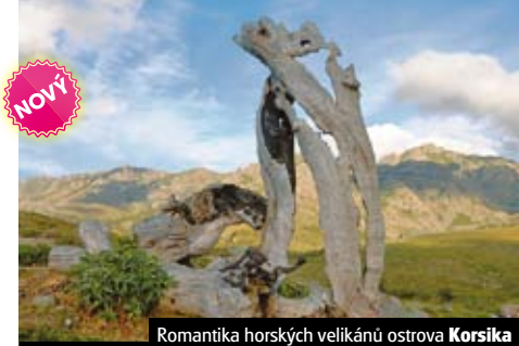
Romantika horských velikánů ostrova Korsika