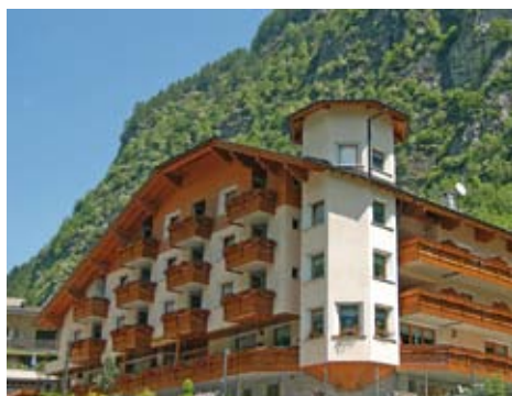
Hotel, ve kterém budete v Madesimu bydlet

Příplatek 1.600 Kč za jednolůžkový pokoj.