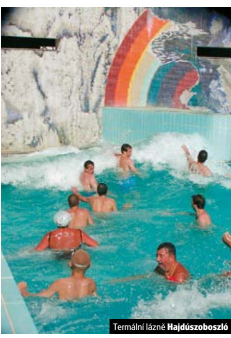
Termální lázně Hajdúszoboszló

Pobyty v termálních lázních Nabízíme vám ubytování v blízkosti termálních lázní Hajdúszoboszló, Eger, Tapolca a Budapešti na vlastní dopravu v cenách již od 790 Kč/os./noc hotel se snídaní, polopenzí. Informace v CK nebo na www.geops.cz.