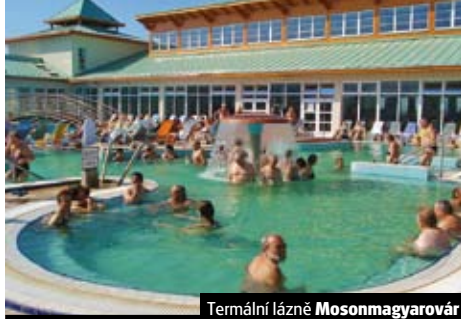
Termální lázně Mosonmagyaróvár