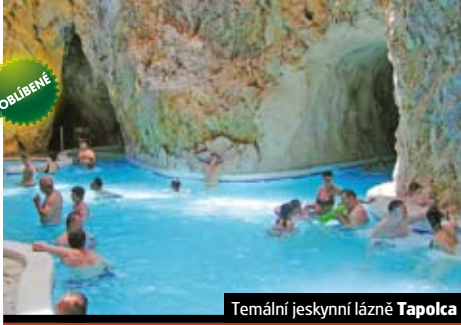
Temální jeskynní lázně Tapolca