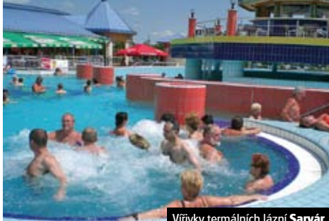
Vířivky termálních lázní Sarvár