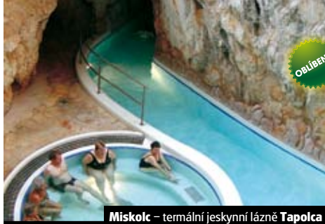
Miskolc – termální jeskynní lázně Tapolca