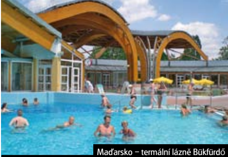
Maďarsko – termální lázně Bükfürdő