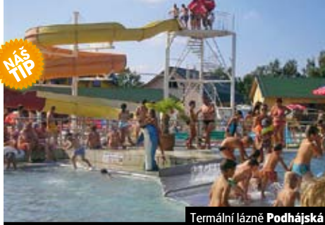
Termální lázně Podhájská