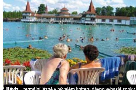
Hévíz – termální lázně v bývalém kráteru dávno vyhaslé sopky