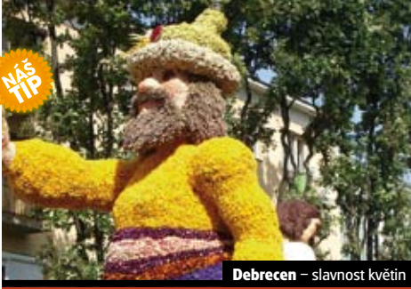
Debrecen – slavnost květin