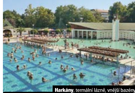
Harkány, termální lázně, vnější bazény

Žádejte informace v CK nebo na www.geops.cz