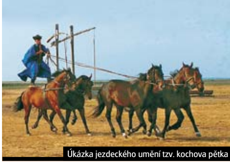
Úkázka jezdeckého umění tzv. kochova pětka