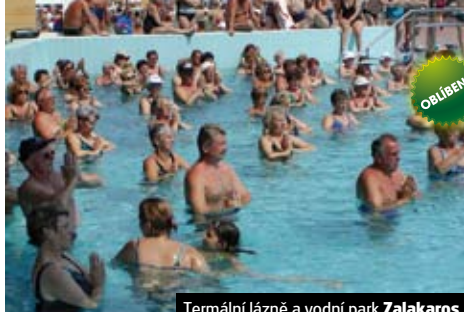
Termální lázně a vodní park Zalakaros

Poznámka: Výstavy doporučujeme rezervovat předem. Příplatek za výstavu 260 Kč dospělá a 180 Kč studenti.