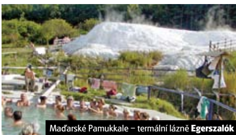
Maďarské Pamukkale – termální lázně Egerszalók