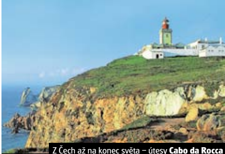
Z Čech až na konec světa – útesy Cabo da Rocca