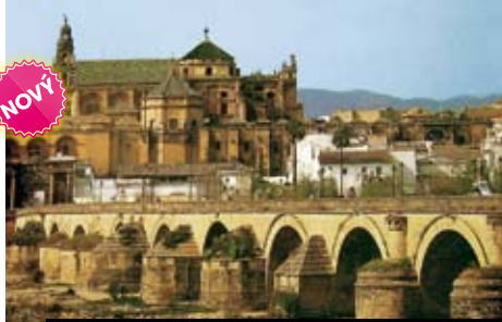
Toledo – kamenný most pamatuje boje Maurů s křesťany

Celková cena u leteckých zájezdů vč. letišt. a bezpeč. tax ke dni tisku katalogu: od 22.5. – 17.990 Kč; od 10.7. – 21.890 Kč; od 4.9. – 18.490 Kč; od 25.9. do 2.10. – 17.690 Kč; od 25.9. do 3.10. – 13.890 Kč.