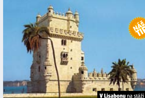
V Lisabonu na stáži