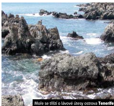
Moře se tříští o lávové útesy ostrova Tenerife