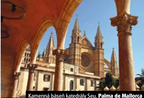
Kamenná báseň katedrály Seu, Palma de Mallorca