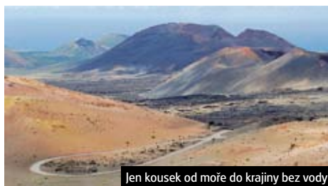
Jen kousek od moře do krajiny bez vody

Kanárské ostrovy a slavnost květinového karnavalu Navštívíte ostrovy Tenerife, La Gomera a La Palma, El Hierro a to v době největších slavností na ostrově na str. 65.