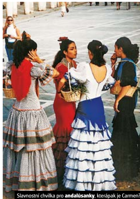
Slavnostní chvíle pro andalusanky, která je Carmen?