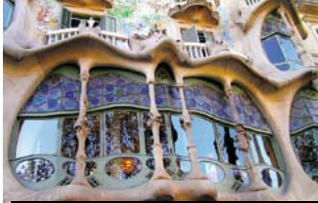
Casa Batlló fantastické krajčovní secesní architektury Gaudiho