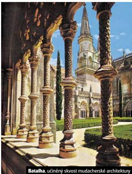
Batalha, učiněný skvost mudacherské architektury