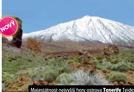
Majestátnost nejvyšší hory ostrova Tenerife Teide