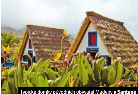
Typické domky původních obyvatel Madeiry v Santaně