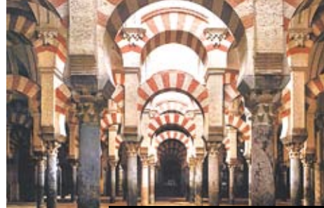
Córdoba – původně mešita, pak katedrála