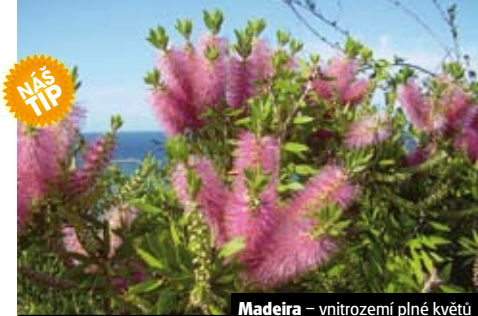
Madeira – vnitrozemí plné květů