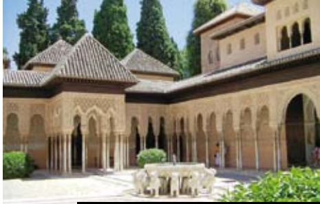
Lví fontána v Alhambře jak v Tisíce a jedné noci