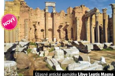
Úžasné antické památky Libye Leptis Magna

Celková cena zájezdu vč. letišť. a bezpeč. tax je 33.890 Kč ke dni tisku katalogu.