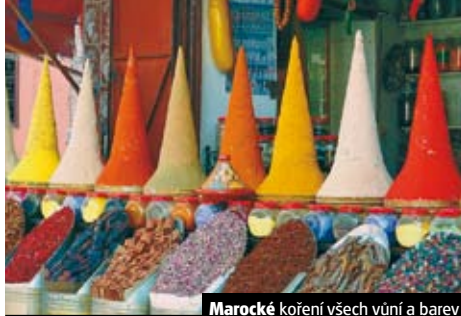
Marocké koření všech vůní a barev