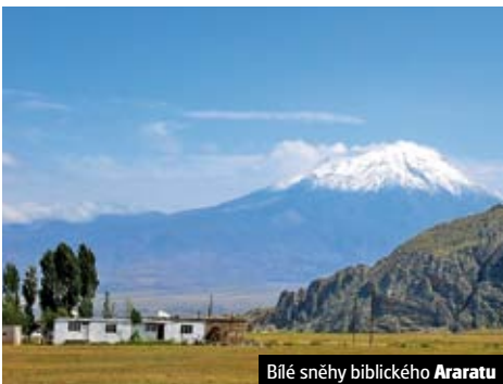
Bílé sněhy biblického Araratu

Celková cena zájezdu vč. letišť. a bezpeč. tax je 31.790 Kč ke dni tisku katalogu.