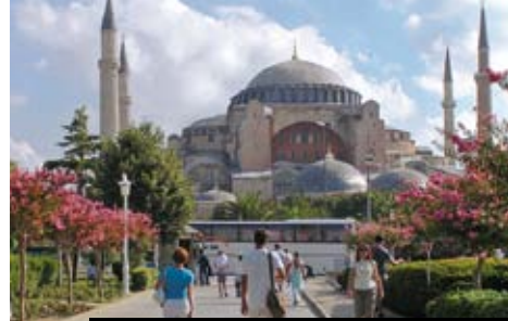
Mešita Hagia Sofia je drahokam v koruně Istanbulu

Celková cena zájezdu vč. letiš. a bezpeč. tax ke dni tisku katalogu: od 5.5. a od 25.8. – 25.990 Kč; od 23.6. a od 14.7. – 26.990 Kč; od 15.9. a od 20.10. – 24.990 Kč.