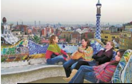
Gaudiho „gauč“ v Güellově parku v Barceloně k večeru