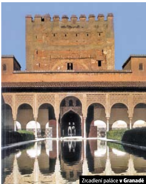
Zrcadlení paláce v Granadě