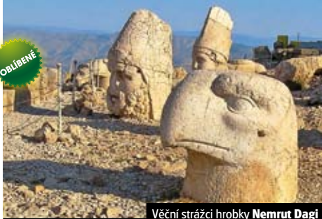
Věční strážci hrobky Nemrut Dagı