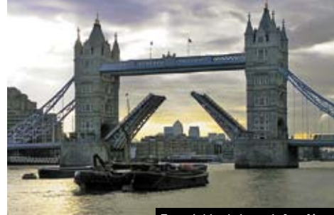
Towerbridge je legenda Londýna