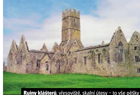
Ruiny kláštera, vřesoviště, skalní útesy – to vše pěšky