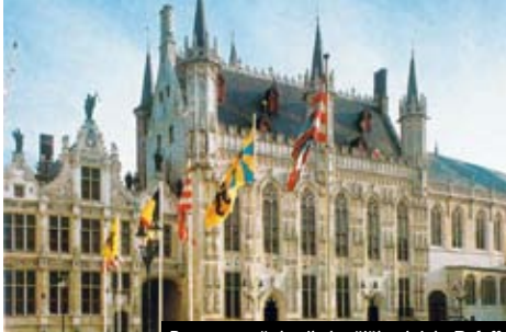
Brugy se pyšní nejkrásnější radnicí v Belgii