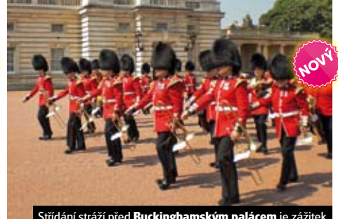
Střídání stráží před Buckinghamským palácem je zážitek

1. den: odjezd z Prahy ráno, transfer do Calais 2. den: LONDÝN , nábřeží Victoria Embankment, London Eye, vládní budovy, Trafalgarské náměstí , Královská opera, Soho a Čínská čtvrt', luxusní třída Piccadilly, Buckinghamský palác, Parlament, Big Ben 3. den: nejstarší britská univerzita v OXFORDU , koleji Christ Church , Shakespearův STRATFORD UPON AVON s jeho rodným domem i hrobem 4. den: LIVERPOOL , nábřeží Pier Head, Metropolitan Cathedral, nejkrásnější anglická katedrála, muzeum Beatles Story , středověký CHESTER , katedrála s pamětní deskou československých letců z 2. svět. války 5.–6. den: LONDÝN , dokončená prohlídka, Muzeum voskových figurín Madame Tussaud, možnost návštěvy, Regents park, Baker Street, muzeum Sh. Holmese, Oxford Street, katedrála sv. Pavla, exteriéry Tower of London, Tower Bridge, fakult. vláčkem nebo lodí do GREENWICH , odjezd v podvečer, transfer do ČR, návrat v podvečer Cena zahrnuje dopravu autobusem, Eurotunel/trajekt, 3x hotel se snídaní (2lůž. pokoje), průvodce, komplexní pojištění; nezahrnuje vstupné (50 GBP). Sleva 450 Kč 3. osoba na přistýlce. Příplatek 1.800 Kč za 1lůžkový pokoj.