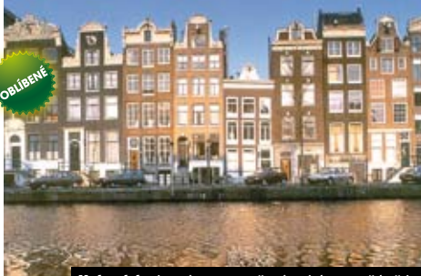
Holandsko je právem označováno jako země květín