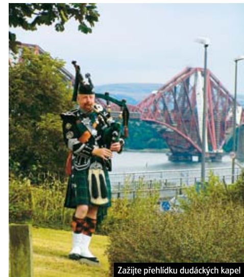
Zažijte přehlídku dudáckých kapel