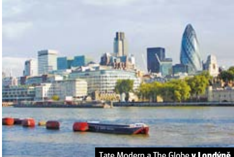
Tate Modern a The Globe v Londýně