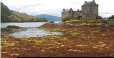
Grady a jezera na ostrově Skye dojírají svou nostalgii