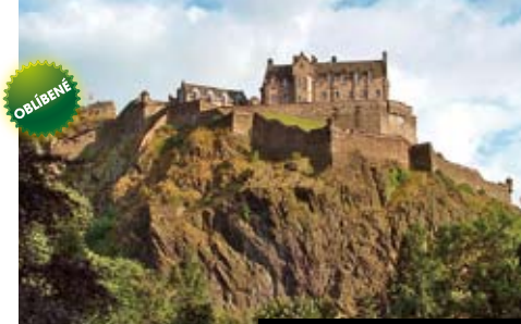
Edinburg, hlavní město Skotska