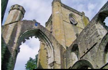
Skotsko a svět katedrál (katedrála Dunkeld)