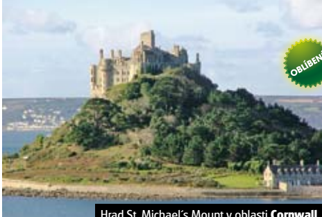
Hrad St. Michael's Mount v oblasti Cornwall

1. den: odlet ráno z Prahy do LONDÝNA , prohlídka metropole na Temži , pevnost Tower, Tower Bridge, finanční centrum The City, katedrála sv. Pavla, ubytování u metra 2. den: půldenní výlet do WINDSORU , rezidence anglické královské rodiny, návrat do LONDÝNA, Piccadilly Circus, Trafalgar Square, čtvrt' Soho, muzea, fakult. večere 3. den: LONDÝN , Westminster Abbey, Parlament a Big Ben, vládní třídy Whitehall a Downing Street, Buckingham Palace, indiv. Volno, odjezd do ČR, Eurotunel 4. den: příjezd v odpoledních hodinách (Si) Cena zahrnuje letenku Praha-Londýn, letiště, a bezpeč. taxy (500 Kč), dopravu autobusem, 2x hotel (2 lůžk. pokoje), 2x snídaní, průvodce; nezahrnuje vstup (60 GBP).