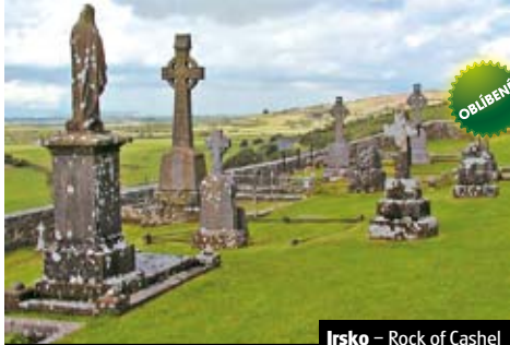
Irsko – Rock of Cashel