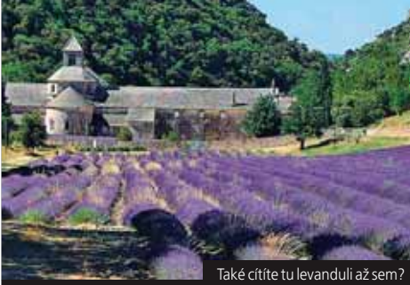
Také cítíte tu levanduli až sem?