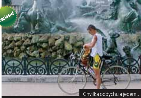
Chvilka oddechu a jedem...