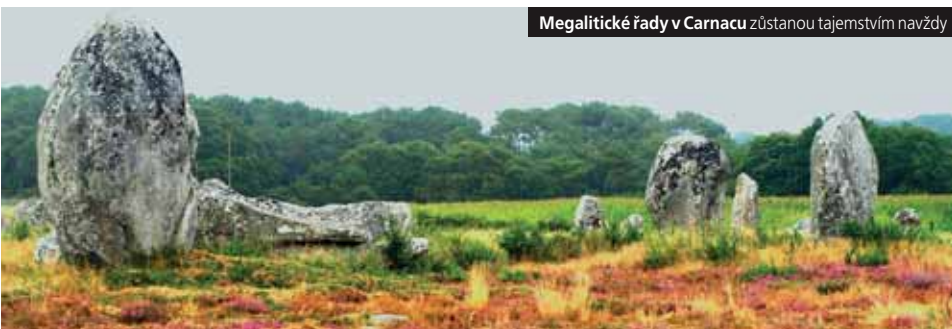
Megalitické řady v Carnacu zůstanou tajemstvím navždy

Cena od 5.990 Kč/5.590 Kč pro 40 osob/studentů (3lůž.).