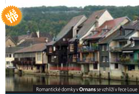
Romantické domky v Ornans se vzhlíží v řece Loue