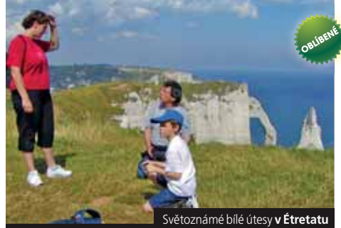
Světově známé bílé útesy v Étretatu