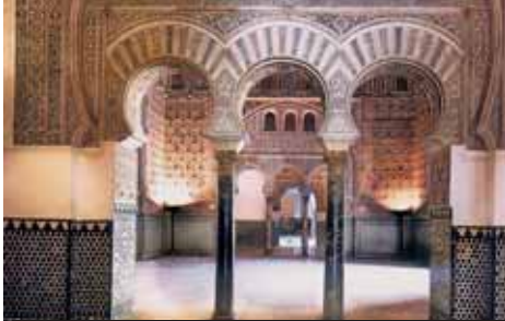
Katedrála v Cordobě – maurská a křesťanská kultura pospolu