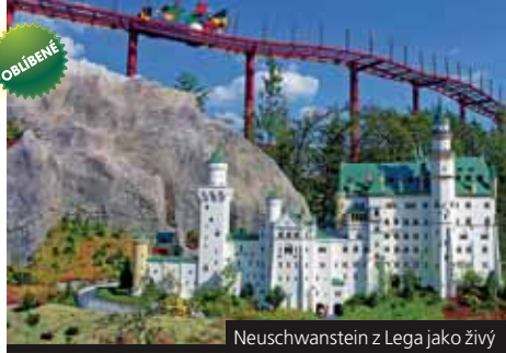
Neuschwanstein z Lega jako živý