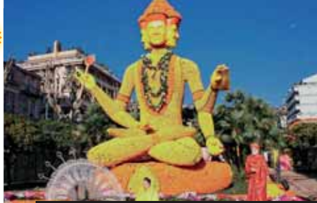
Podivuhodné sochy z citrusů v Mantonu a vůně mimóza