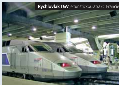
Rychlovlak TGV je turistickou atrakcí Francie