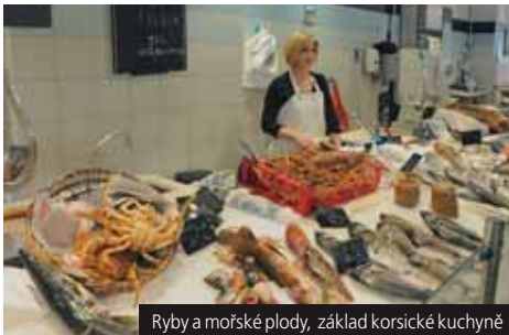
Ryba a mořské plody, základ korsické kuchyně

Příplatek 2.200 Kč za komplexní pojištění.