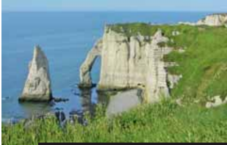
Étretat na Falaise d'Aval – bílé útesy nad La Manche