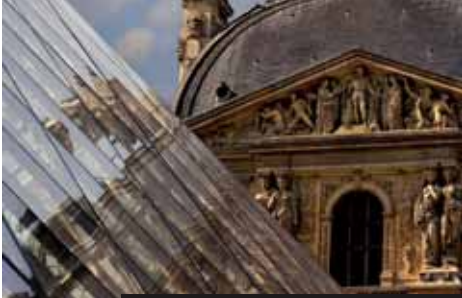
Galerie Louvre stále přitahuje tisíce návštěvníků