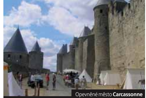
Opevněné město Carcassonne