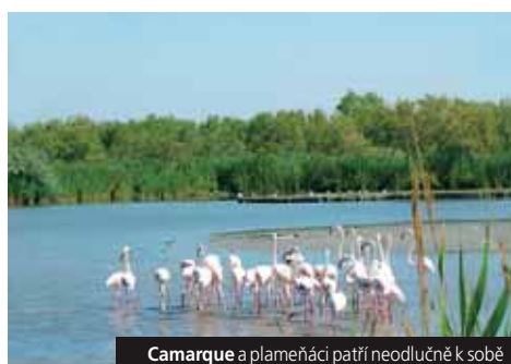
Camarque a plameňáci patří neodlučně k sobě