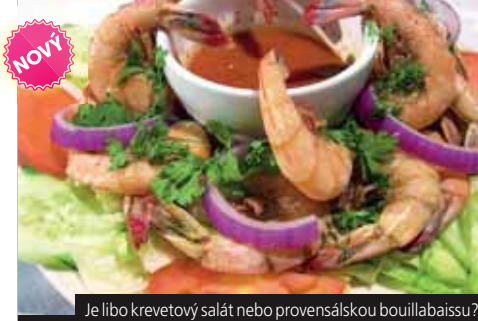
Je libo krevetový salát nebo provensálskou bouillabaisse?

Tematické zájezdy za uměním a přírodou Francie www.francie-zajezdy.cz