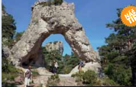
Mykénská brána v Montpellier le Vieux