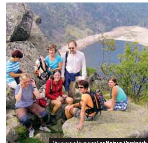
Vysoko nad jezerem Lac Noir ve Vogézách

Sleva 360 Kč/os. pro 3 osoby ve 3lůžkovém pokoji. Příplatek 1.500 Kč za 1lůžkový pokoj. Příplatek 490 Kč za 3x snídaní. Příplatek 500 Kč 1x večeri 4. den Příplatek 168 Kč za komplexní pojištění. Cena od 5.990 Kč pro 40 osob/studentů (3lůž.).