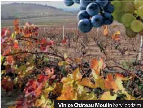
Vinice Château Moulin barví podzim