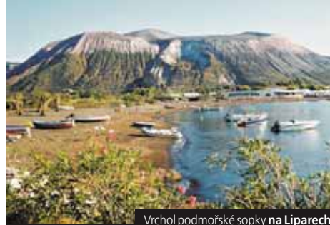
Vrchol podmořské sopky na Liparech