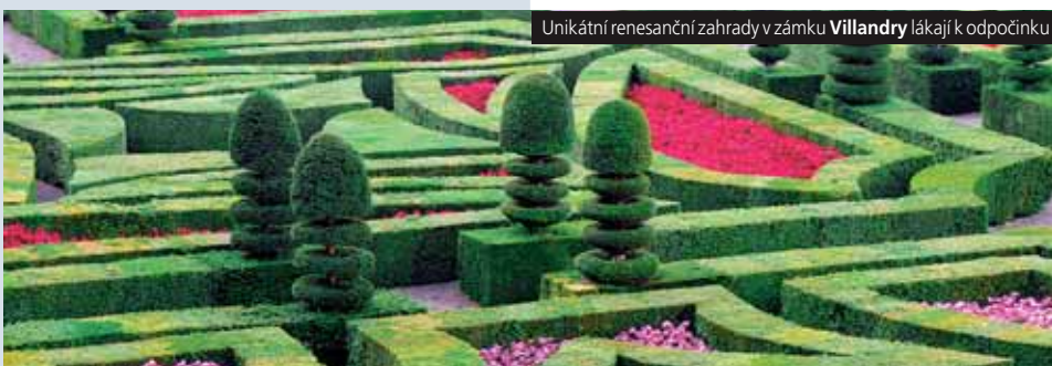
Unikátní renesanční zahrady v zámku Villandry lákají k odpočinku