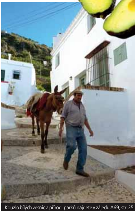
Kouzlo bílých vesnic a přírod. parků najdete v zájezdu A69, str. 25

Příplatek 900 Kč/os. apartmán pro 3 osoby.