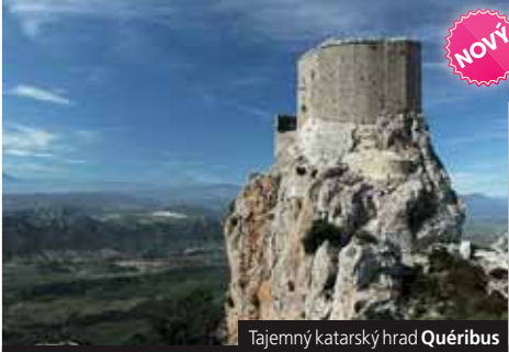
Tajemný katarský hrad Quéribus