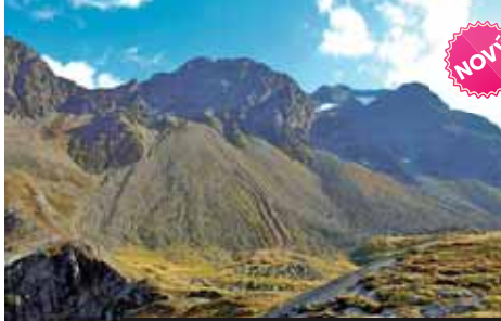
Jen trávy přežívají v drsné krajině alpských skal