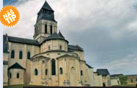
Královské opatství Abbaye de Fontevraud UNESCO