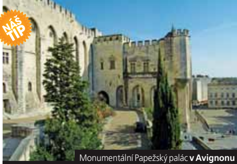
Monumentální Papežský palác v Avignonu