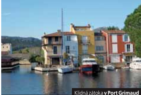
Klidná zátoka v Port Grimaud