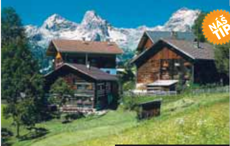
Léto v náručí Vysokých Taur