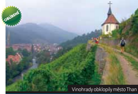
Vinohrady obklopily město Than