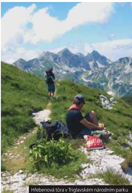
Hřebenová túra v Triglavském národním parku