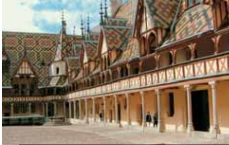
Beaune – burgundské barevné střechy a burgundské víno