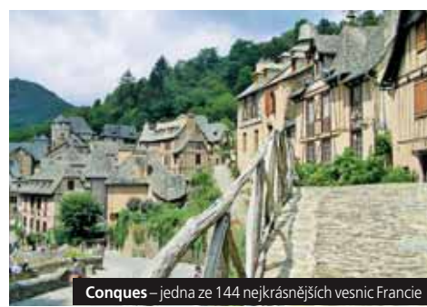
Conques – jedna ze 144 nejkrásnějších vesnic Francie