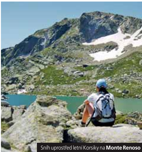
Sníh uprostřed letní Korsiky na Monte Renoso