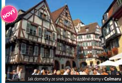
Jak domečky ze sirek jsou hrázděné domy v Colmaru