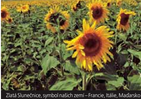
Zlatá Slunečnice, symbol našich zemí – Francie, Itálie, Maďarsko