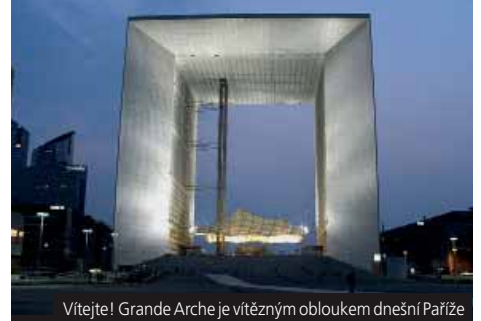
Vítejte! Grande Arche je vítězným obloukem dnešní Paříže