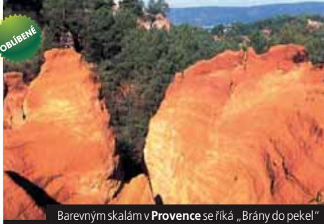
Barevným skalám v Provence se říká „Brány do pekel“