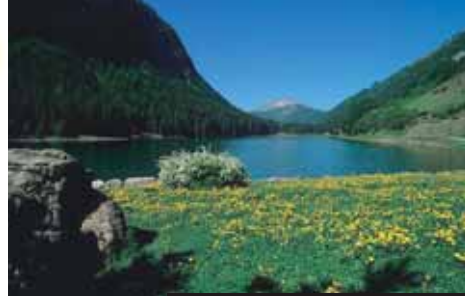
Lac de Montriond v Savojských Alpách