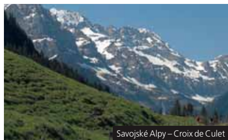
Savojské Alpy – Croix de Culet