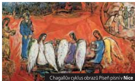
Chagalův cyklus obrazů Píseň písní v Nice

Cena zahrnuje dopravu autobusem, 3x hotel (2lůž.), průvodce; nezahrnuje komplexní pojištění, vstupné a místní dopravu (70 €) a ochutnávky. Sleva 360 Kč/os. pro 3 osoby (pro studenty). Příplatek 2.000 Kč za 1 lůžkový pokoj. Příplatek 480 Kč za 3x snídaně. Příplatek 550 Kč za 1x večere. Příplatek 168 Kč za komplexní pojištění.