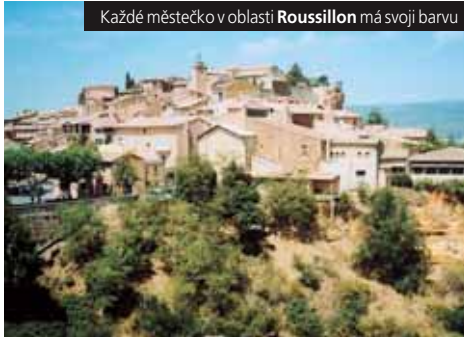
Každé městečko v oblasti Roussillon má svoji barvu