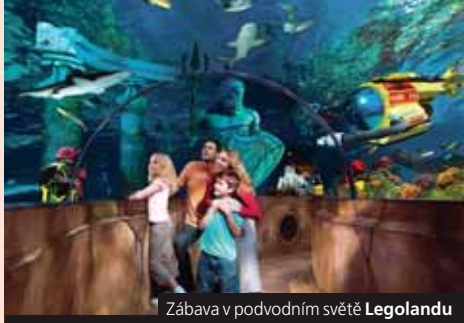
Zábava v podvodním světě Legoland