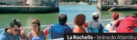
La Rochelle – brána do Atlantiku

Příplatek 196 Kč za komplexní pojištění.