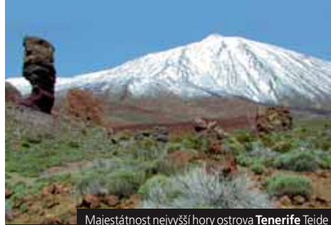
Majestátnost nejvyšší hory ostrova Tenerife Teide