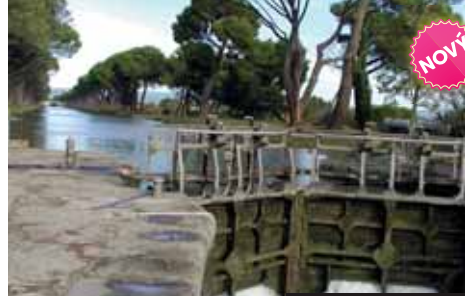
Vrata na Canal du Midi