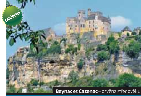
Beignac et Cazenac – ozvěna středověku