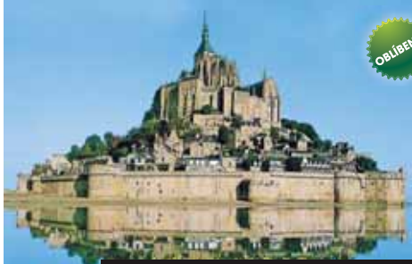
Mont St. Michel v Bretani láká svým tajemstvím