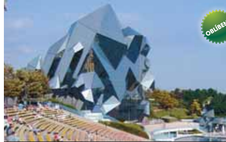
Největší park filmových projekcí Evropy – Futuroscope v Poitiers