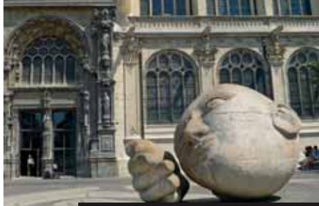
Historie i moderna u kostela sv. Eustacha v Paříži