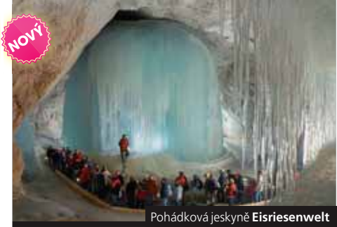
Pohádková jeskyně Eisriesenwelt