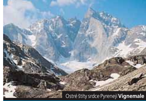
Ostré štíty srdce Pyrenejí Vignemale