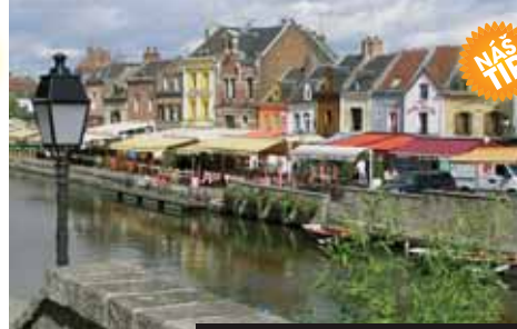
Amiens, bývalé domky výrobců sametu