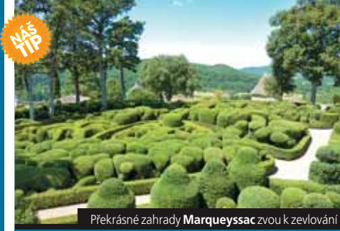
Prékrásné zahrady Marqueyssac zvou k zevlování