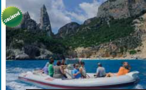
K některým plážím Cala Gonone se dostanete jen lodí