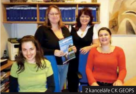
Z kanceláře CK GEOPS