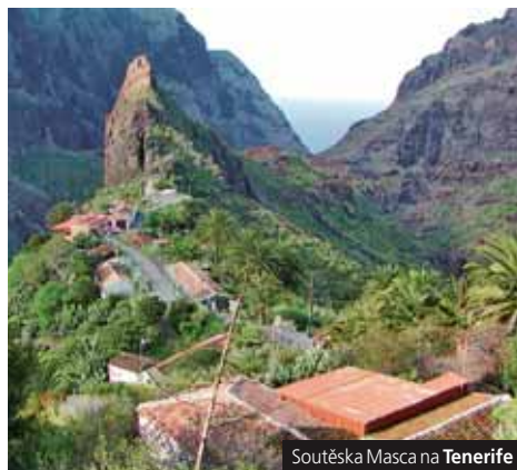
Soutěska Masca na Tenerife

Příplatek 250 Kč za přípojištění vyššího storna zájezdu