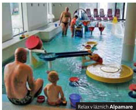
Relax v lázních Alpamare