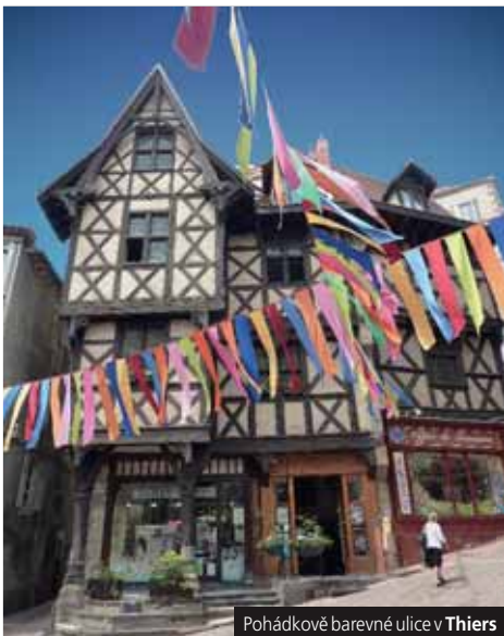
Pohádkově barevné ulice v Thiers

Cena dopravu autobusem, 5x ubytování (2x Albertville, 3x údolí Aosta, 2lůž. pokoje), 5x snídaní, 3x večeří, vedoucí zájezdu, komplexní pojištění; nezahrnuje vstupné a lanovky (70 €).