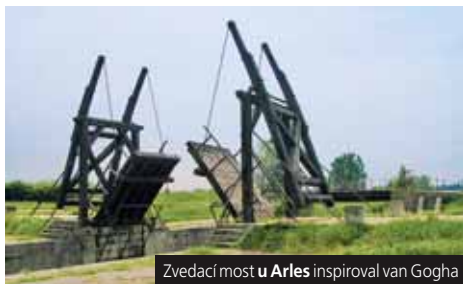
Zvedací most u Arles inspiroval van Gogha

1. den: odjezd z Prahy v 15 h, (Pl; svoz od 6 osob: HK, Pa – 300 Kč; Br za příplatek 400 Kč), transfer přes SRN 2. den: antické město ORANGE – ☉, vítězný oblouk, divadlo, papežský AVIGNON – ☉, most St-Bénézet, katedrála, Papežský palác, provensálské uličky, fakult. lodí po Rhôně, výhledy na Villeneuve les Avignon a na Eiffelův most 3. den: van Goghovo ARLES – ☉, aréna, římské a románské památky, klášter St-Trophime, Goghova nemocnice, kavárna a most z obrazů van Gogha, přírodní park Camargue s bílými koňmi a plameňáky , ornitologický park (pěšmo, koňmo nebo vláčkem), poutní městečko STES-MARIES-DE-LA-MER , katedrála, ochutnávka vína, velikonoční výzdoba a všude plno květů 4. den: CASSIS, Calanques, středomořské „fjordy“ , koupání, pěšky nebo lodí podél pobřeží, MARSEILLE , starý přístav, bazilika St-Victor, chrám Notre-Dame-de-la-Garde, fakult. výlet na ostrov hraběte Monte Christa If nebo na Frioulské ostrovy , fakult. večere v rybí restauraci 5. den: návrat do Prahy odpoledne Cena zahrnuje dopravu lůžkovým autobusem, 2x hotel (2lůž. pokoje), průvodce; nezahrnuje komplexní pojištění, večeri, fakultativní služby a vstupné (60 €). Sleva 240 Kč/os. pro 3 osoby ve 3lůžkovém pokoji. Příplatek 1.300 Kč za 1lůžkový pokoj. Příplatek 300 Kč za 2x snídaně. Příplatek 550 Kč za 1x večere. Příplatek 140 Kč komplexní pojištění.