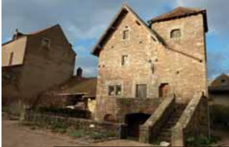
Brancion – jedna z nejkrásnějších vesnic Francie