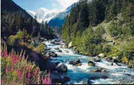
Národní park Gran Paradiso je vskutku alpský ráj