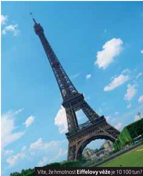
Víte, že hmotnost Eiffelovy věže je 10 100 tun?