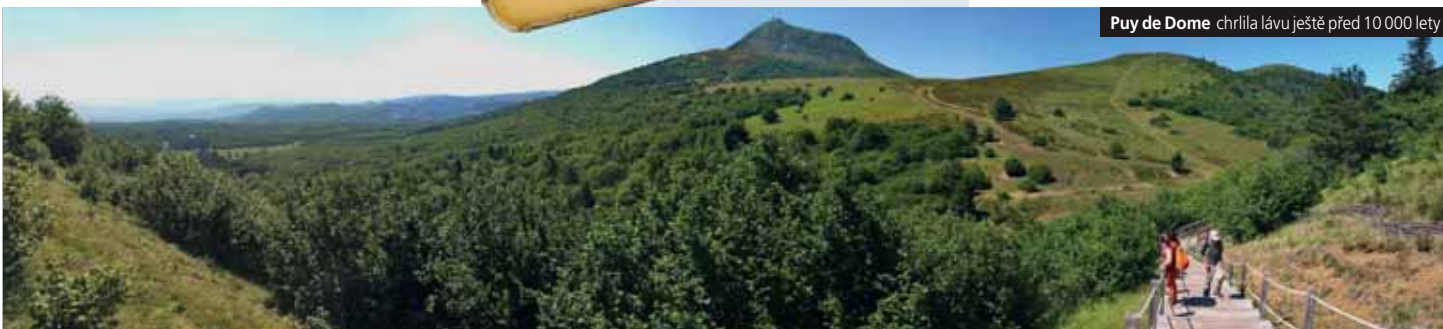
Puy de Dome chrlila lávu ještě před 10 000 lety

Příplatek 230 Kč za komplexní pojištění.