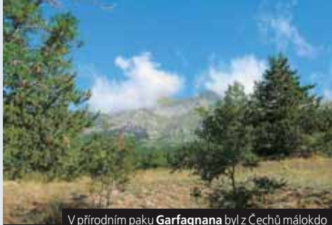
V přírodním paku Garfagnana byl z Čechů málokdo