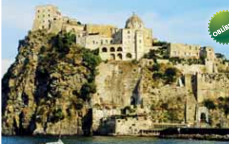
Aragonský hrad stráží ostrov termálů Ischia