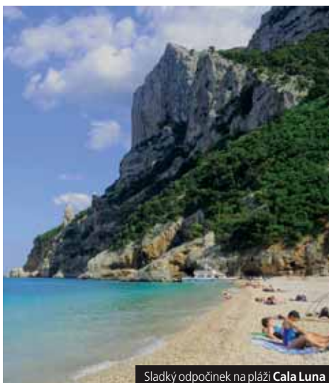
Sladký odpočinek na pláži Cala Luna