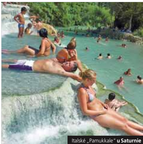
Italské „Pamukkale“ u Saturnie