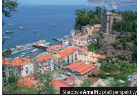
Starobylé Amalfi z ptáčích perspektivy