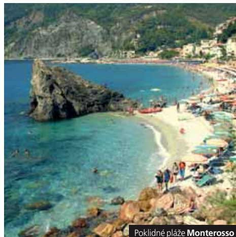
Poklidné pláže Monterosso