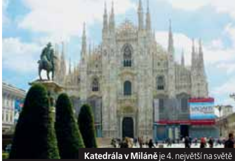
Katedrála v Miláně je 4. největší na světě