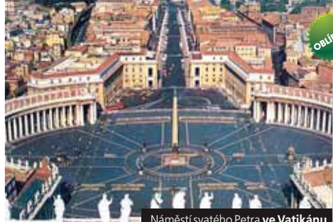
Náměstí svatého Petra ve Vatikánu