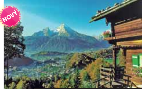
Romantika horské krajiny dojmů snad každého