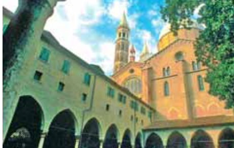
Nádvorí baziliky del Santo je přímo stvořené k rozjímání