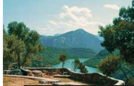
Jestli někde najdete ráj na Zemi, pak možná v Sardinii