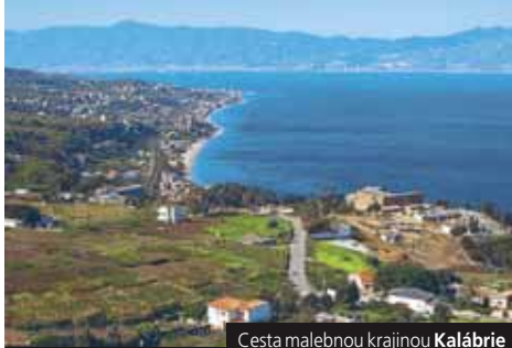
Cesta malebnou krajinou Kalábrie