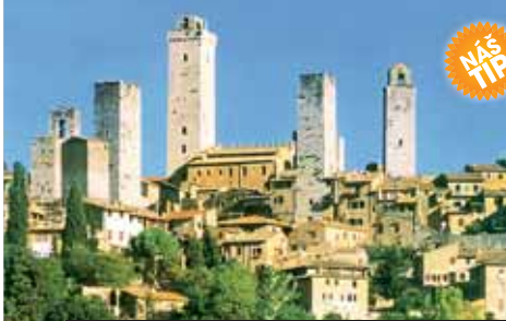
San Gimignano má zachovalých rodových věží nejvíce

Příplatek 140 Kč za komplexní pojištění.