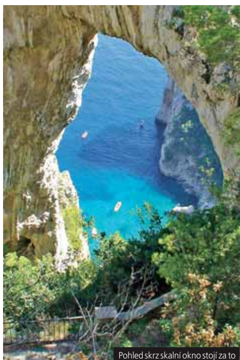
Pohled skrz skalní okno stojí za to

Cena zahrnuje dopravu autobusem, 7x ubytování v APT/vile, 7x snídaní a 6x večeří (česká kuchyně), průvodce, komplexní pojištění; nezahrnuje vstupné a loď na Capri (90 €). Příplatek 2.000 Kč/os. ubytování v hotelu s polopenzí.