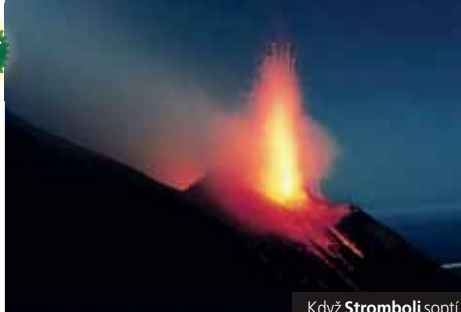
Když Stromboli soplí