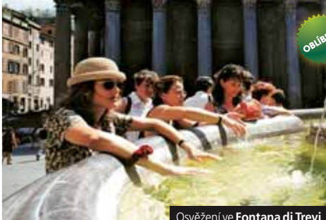
Osvěžení ve Fontana di Trevi