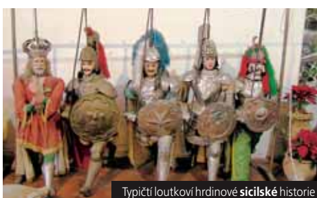
Typičtí loutkoví hrdinové sicílské historie