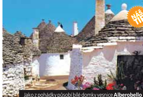
Jako z pohádky působí bílé domky vesnice Alberobello