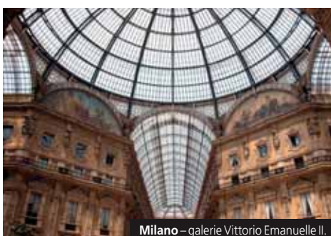
Milano – galerie Vittorio Emanuele II.