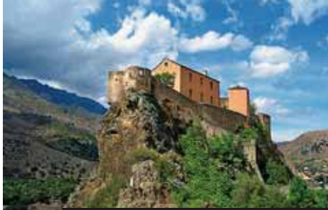
Horské městečko Corte slhází na přírodní ráj Korsiky