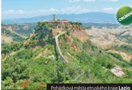
Pohádková města etruského kraje Lazio