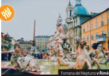
Fontana del Neptuno v Římě