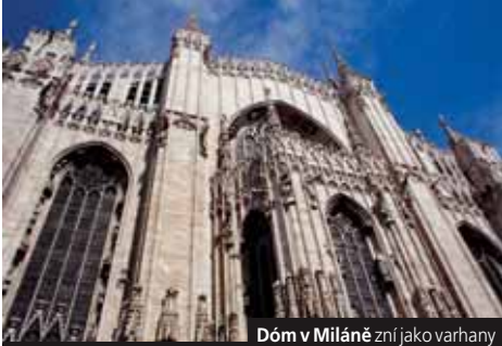
Dóm v Miláně zní jako varhany