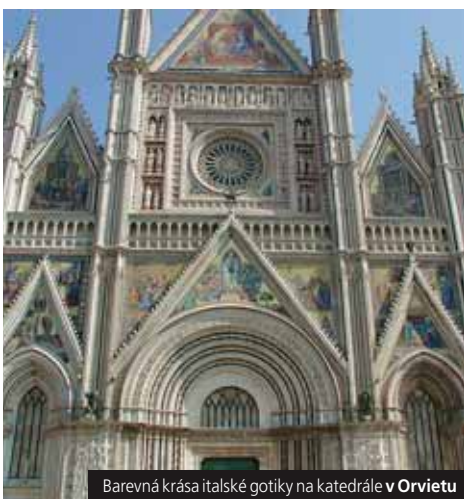
Barevná krása italské gotiky na katedrále v Orvietu

Cena od 6.590 Kč pro kolektiv 40 studentů zahrnuje 3x ubytování, 3x snídaně, dopravu, průvodce, pojištění.