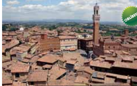
Víte že má Siena nejkrásnější náměstí na světě?