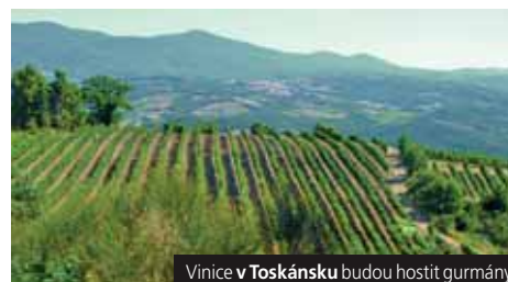
Vinice v Toskánsku budou hostit gurmány