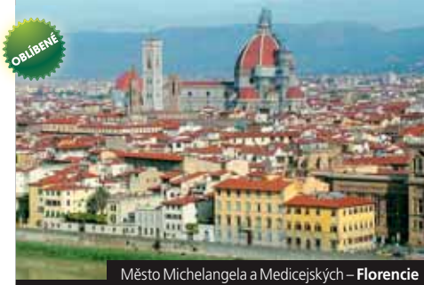
Město Michelangela a Medicejských – Florencie

Eurovíkend Řím od 10.990 Kč www.geops.cz