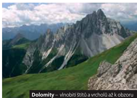
Dolomity – vlnobití štítů a vrcholů až k obzoru