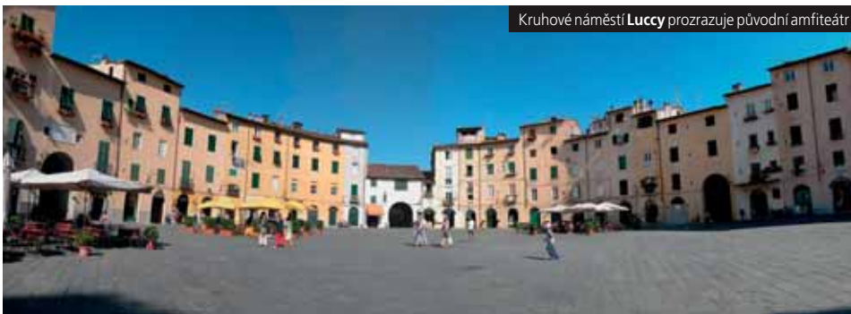
Kruhové náměstí Luccy prozrazuje původní amfiteátr

Cena zahrnuje letenku Praha–Bari–Praha, letištní taxy, transfery autobusem, 3x hotel, 3x snídaně, průvodce, 2x ochutnávka, vstup do svatyně S.T.Maria a na maják; cena nezahrnuje komplexní pojištění (112 Kč) a další vstupné (50 €).