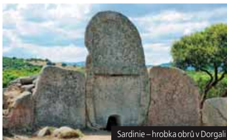
Sardinie – hrobka obrů v Dorgali

Příplatek za neobsazené lůžko v bungalovu na dotaz v CK.