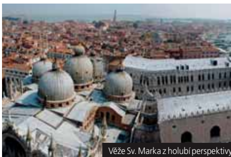
Věže Sv. Marka z holubí perspektivy