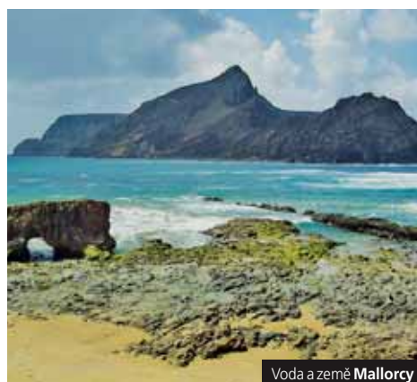
Voda a země Mallorcy