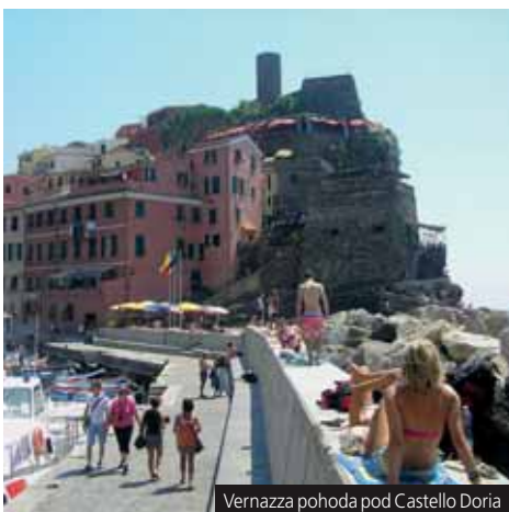
Vernazza pohoda pod Castello Doria

Příplatek 196 Kč za komplexní pojištění.