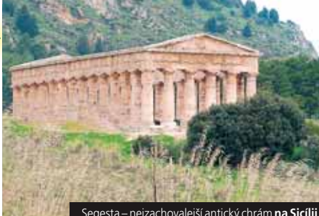
Segesta – nejzachovější antický chrám na Sicílii

Příplatek 168 Kč za komplexní pojištění.