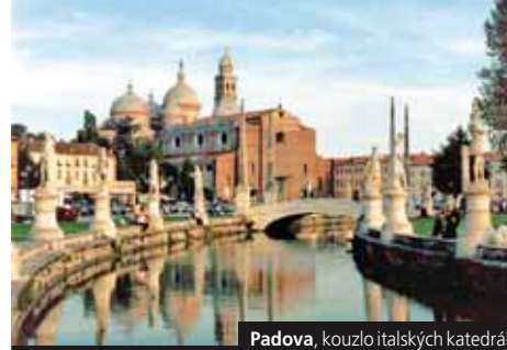
Padova, kouzlo italských katedrál

Cena zahrnuje dopravu autobusem, 1x hotel (2lůž. pokoje) se snídaní, průvodce, komplexní pojištění; nezahrnuje vstupné (cca 45 €) a cesty lodí (dvoudenní 25 €). Příplatek 600 Kč za 1 lůžkový pokoj, 350 Kč za 1x večeři.