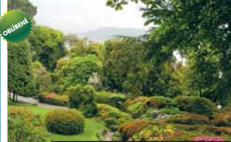
Tremezzo – zahrada vily Carlotta. No není krásná?