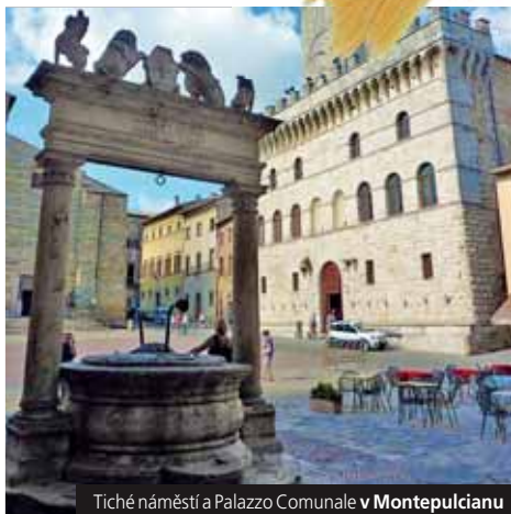
Tiché náměstí a Palazzo Comunale v Montepulciano