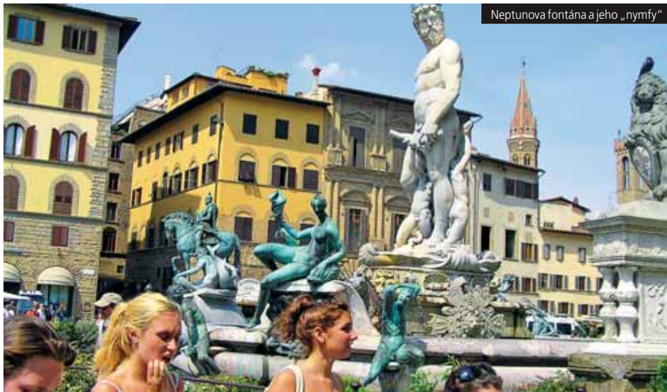
Neptunova fontána a jeho „nymfy“