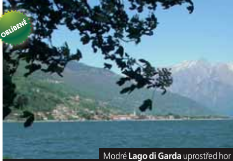
Modré Lago di Garda uprostřed hor