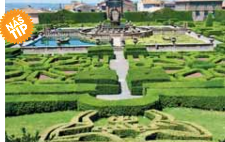
Zahrady Villa Lante nedaleko Viterba vás prostě omráčí

1.–2. den: odjezd z Prahy ve 12h (HK, Pa, ČB nebo Pl, Br za 400 Kč), noční přejezd, ŘÍM a Vatikán: Vatikánská muzea, Sixtinská kaple , variantně návštěva Vatikánských zahrad mikrobusem, chrám sv. Petra , Andělský hrad, Piazza Navona a fontány, večere 3. den: letní sídlo papeže San Gandolfo, TIVOLI , jedinečné zahrady, dvě památky UNESCO: Hadriánova vila , anticke sídlo císaře Hadriána, Villa d'Este , letní sídlo kardinála Ippolita d'Este, renesanční zahrady s fontánami a vodopády, skvělá zahradní architektura (Bernini), SUBIACO , klášter nad divokou strží, večerní FRASCATI , možnost ochutnávky vín a porchetty, manýristické zahrady 4. den: ŘÍM , skvosty architektury antiky, renesance i baroka: francouzské zahrady Borghese , botanické zahrady Trastevere , pro zájemce Villa Borghese s galerií – Botticelli, Raffaello, Tiziano, Carvaggio (rezervace nutná předem), odjezd z Říma pozdě večer 5. den: návrat v odpoledne Cena zahrnuje dopravu autobusem, 2x hotel (2lůž. pokoj), 2x snídaně, 1x večere, průvodce; nezahrnuje komplexní pojištění, dopravu po Římě a vstupné (40 €). Příplatek 800 Kč 1lůžk.pokoj, 400 Kč 1x další večere. Příplatek 300 Kč za zálohu do muzea Borghese. Příplatky 400 Kč za zálohu na zahrady nebo muzea Vatikánu (nutná rezervace nejpozději měsíc předem). Příplatek 140 Kč za komplexní pojištění.