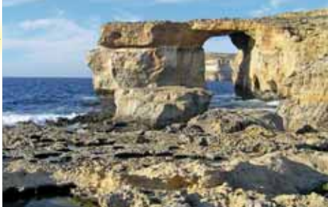
Kamenné okno na ostrově Gozo