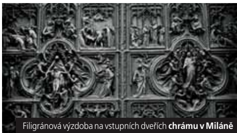
Filigránová výzdoba na vstupních dveřích chrámu v Miláně

Cena zahrnuje dopravu autobusem, 3x hotel, 3x snídaně, průvodce, komplexní pojištění; nezahrnuje vstupné (60 €). Příplatek 2.200 Kč za 1lůžkový pokoj.