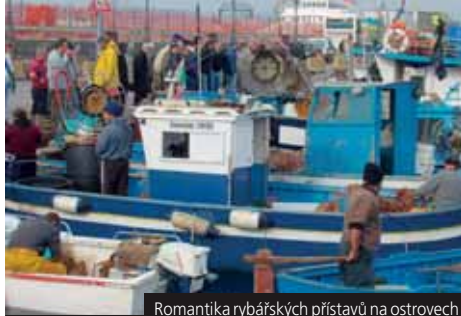
Romantika rybářských přístavů na ostrovech