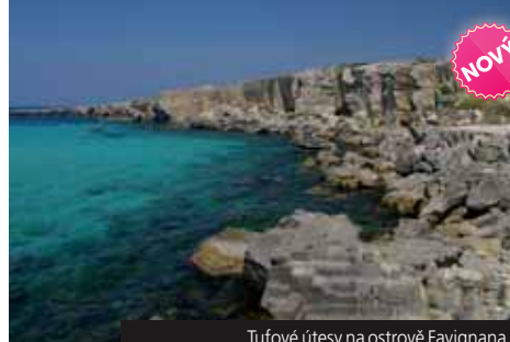
Tufové útesy na ostrově Favignana