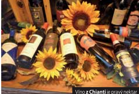
Vino z Chianti je pravý nektar