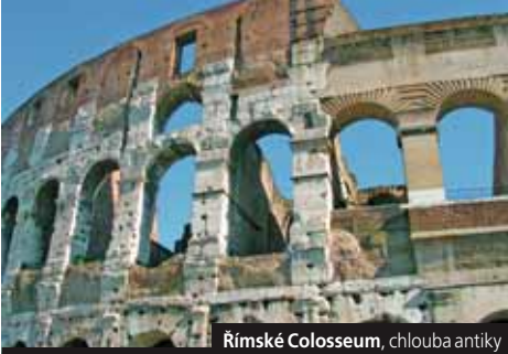
Římské Colosseum, chloubka antiky