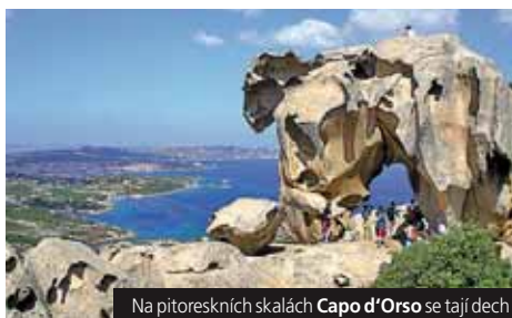
Na pitoreskních skalách Capo d'Orso se tají dech