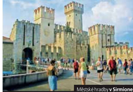
Městské hrady v Sirmione

Cena zahrnuje dopravu autobusem, 4x hotel (2lůžkové pokoje), 4x snídaně, průvodce; nezahrnuje komplexní pojištění, vstupy Příplatek 1.980 Kč za 1 lůž. pokoj, 960 Kč za 3x večeři Příplatek 168 za komplexní pojištění