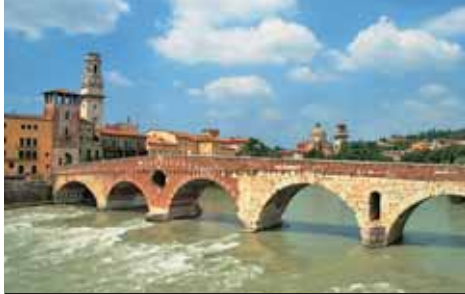
Ponte Pietra, jeden z mostů, který vás přivede do centra Verony