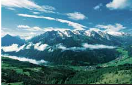
Srdce Zillertálských Alp – masiv Hintertux