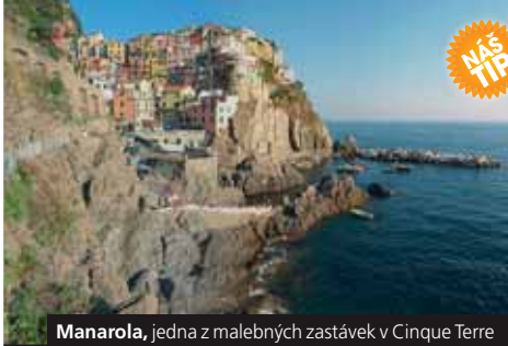
Manarola, jedna z malebných zastávek v Cinque Terre

Cena zahrnuje dopravu autobusem, 7x mobilhomy (2lůž. ložnice), průvodce, komplexní pojištění, užívání bazénu; nezahrnuje fakult. akce a vstupné.