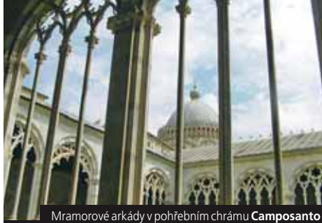
Mramorové arkády v pohřební chrámu Camposanto