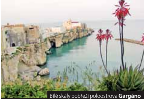
Bílá skála pobřeží poloostrova Gargáno