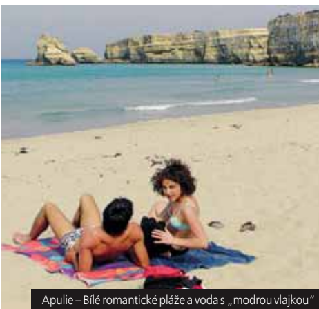
Apulie – Bílé romantické pláže a voda s „modrou vlajkou“

Příplatek 1.500 Kč/os za studio pro 2 osoby.