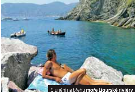
Slunění na břehu moře Ligurské riviéry