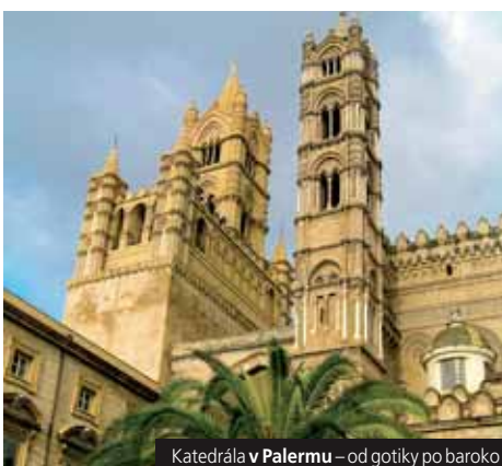
Katedrála v Palermu – od gotiky po baroko

V termínu s * je ubytování na ostrově Ischia (hotel*** s termálními bazénem). Odpadá tedy návštěva Sorrenta. Cena zahrnuje dopravu autobusem, 4x hotel s bazénem, 4x polopenze, průvodce; nezahrnuje komplexní pojištění (196 Kč), trajekty a lodní výlety na Ischii a Capri, dopravu místními busy po ostrovech, dopravu po Římě, místní průvodce a vstupné (celkem 140 €). 1lůž. pokoj – 1.500 Kč.