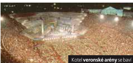
Kotel veronské arény se baví

Cena zahrnuje dopravu autobusem, 2x hotel*** se snídaní, průvodce; nezahrnuje komplex. pojištění, lodní dopravu do/z Benátek a vstupné (30 €). Příplatek 750 Kč za vstupenku na představení Carmen. Příplatek 1.200 Kč za 1 lůžkový pokoj. Příplatek 140 Kč za komplexní pojištění.