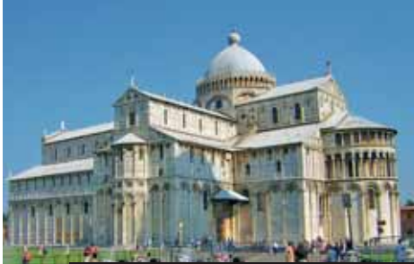
Krása v krajkově – katedrály, věže i Composito v Pise