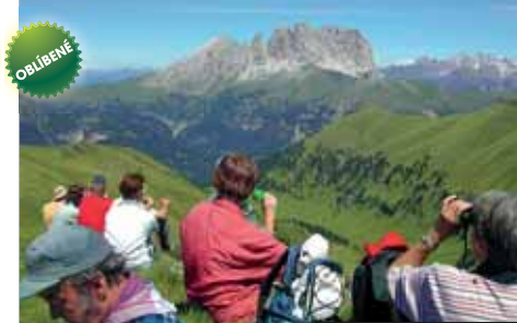
Tak kam vyrazíme teď?

Cena zahrnuje leteckou dopravu, letištní taxy, transfery z letiště do hotelu a zpět, výlety a infomateriály, 7x hotel, 7x bohatá domácí polopenze (servírovaná večere 5 chodů – snídaně švédské stoly), průvodce; nezahrnuje komplexní pojištění (224 Kč), místní dopravu, fakultativní služby (30 €) a nápoje. Příplatek 3.000 Kč za 1lůžkový pokoj.