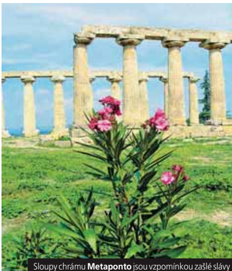
Sloupy chrámu Metaponto jsou vzpomínkou zašlé slávy