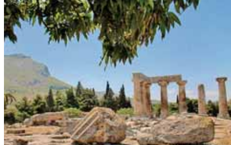
Ruiny starého Korintu jsou svědky dávné slávy antické říše