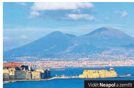
Vidět Neapol a zemřít

Příplatek 250 Kč za fakultativní výlet do Amalfi a Ravella . Příplatek za klimatizaci 5 €/den, za večeri v Rímě cca 12–18 €, lod nebo parkovné v Amalfi cca 15/10 € (platba u průvodce).