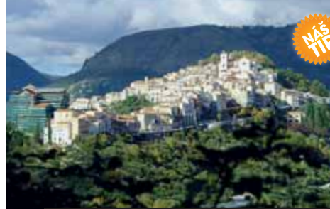
Jako z pohádky působí bílé domky vesnice Rivello