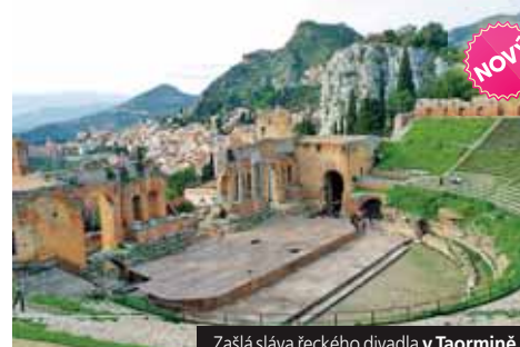
Zašlá sláva řeckého divadla v Taormině