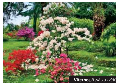
Viterbo při svátku květů