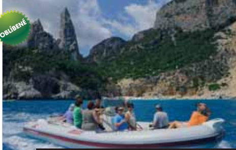
K některým plážím Cala Gonone se dostanete jen lodí