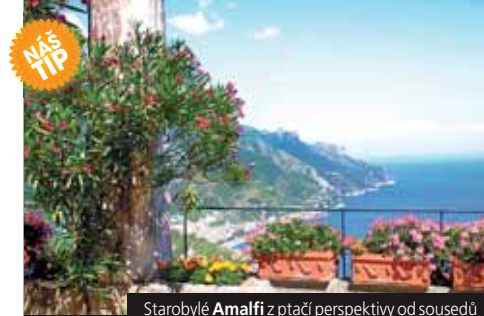
Starobylé Amalfi z ptáčích perspektiv od sousedů

Široká nabídka dalších ubytovacích kapacit na Ischii (hotely ***–*****) . Více informací naleznete na www.geops.cz , nebo na dotaz v CK.