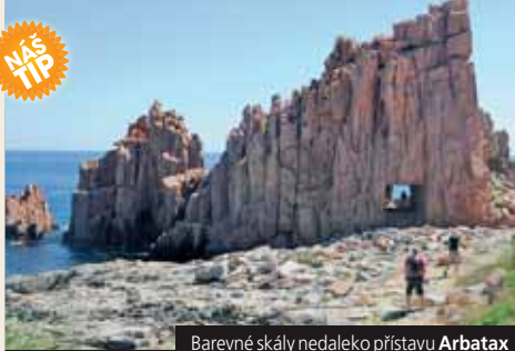
Barevné skály nedaleko přístavu Arbatax