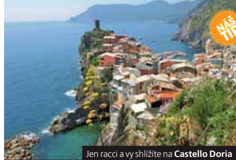
Jen racci a vy shlížíte na Castello Doria