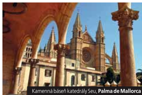
Kamenná báseň katedrály Seu, Palma de Mallorca