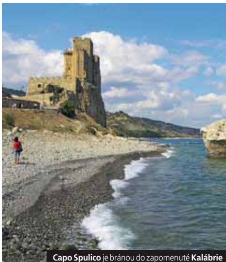
Capo Spulico je bránou do zapomenuté Kalábrie