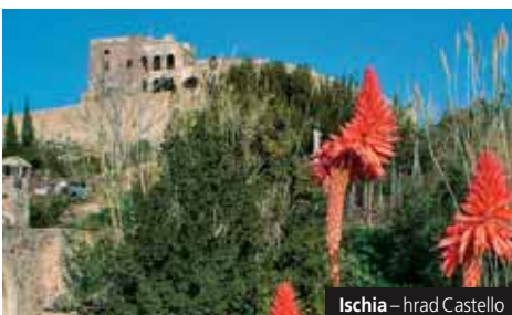
Ischia – hrad Castello

Podrobné informace naleznete na www.geops.cz .