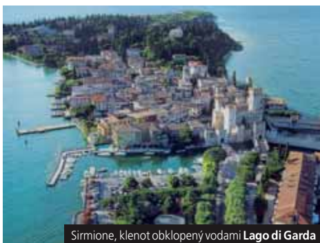
Sirmione, klenot obklopený vodami Lago di Garda