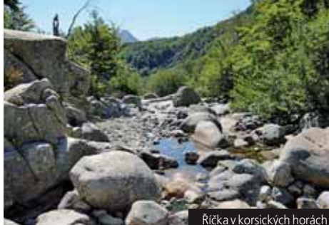
Řička v korsických horách

Příplatek 280 Kč za komplexní pojištění.