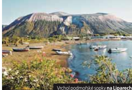
Vrchol podmořské sopky na Liparech