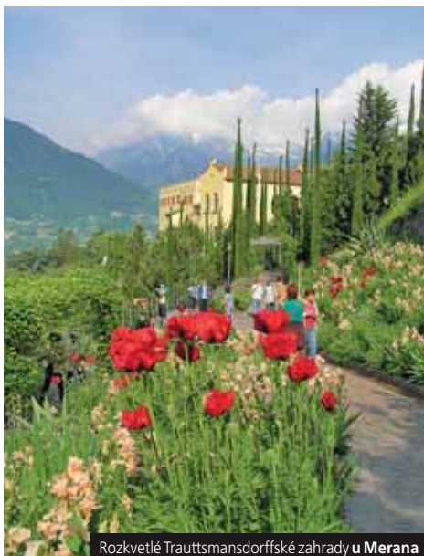
Rozkvetlé Trauttmansdorffské zahrady u Merana