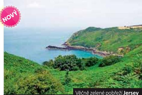
Věčně zelené pobřeží Jersey