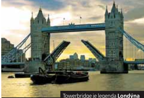
Towerbridge je legenda Londýna