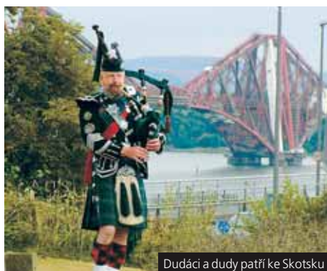
Dudáci a dudy patří ke Skotsku