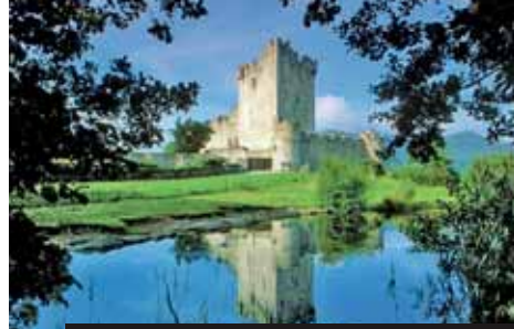
Věčně zelené Irsko a starobylý Ross Castle Killarney