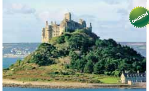
Hrad St. Michael's Mount v oblasti Cornwall