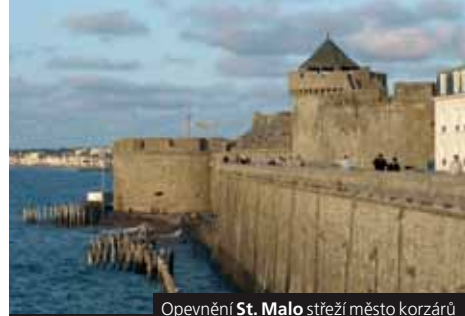
Opevnění St. Malo střeží město korzárů