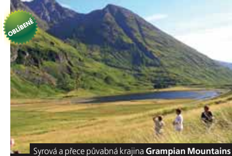
Syravá a přeje půvabná krajina Grampian Mountains

Cena zahrnuje dopravu autobusem, mýtné na ostrov Skye, trajekt přes La Manche (4lůž. kajuty), 6x ubytování hotelového typu, 6x snídaně, průvodce; nezahrnuje komplex. pojištění, vstupné (60 GBP). Příplatek 2.900 Kč za 1lůž. pokoj. Příplatek 280 Kč za komplexní pojištění