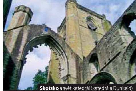
Skotsko a svět katedrál (katedrála Dunkeld)