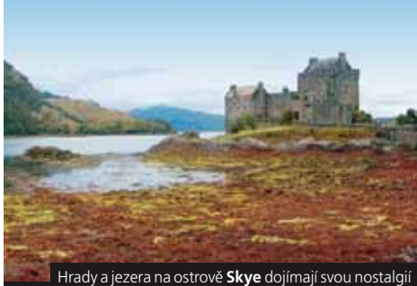
Hrady a jezera na ostrově Skye dojmují svou nostalgii