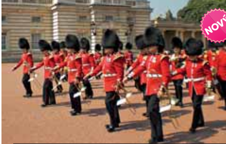
Střídání stráží před Buckinghamským palácem je zážitek