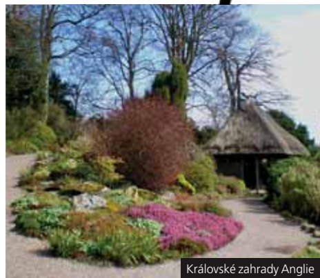
Královské zahrady Anglie