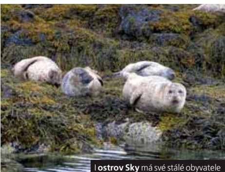
Ostrov Skye má své stálé obyvatelé