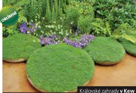
Královské zahrady v Kew

Cena zahrnuje dopravu autobusem, trajekt přes La Manche a Eurotunel /*leteckou dopravu Praha–Londýn–Praha nebo Brno–Londýn–Brno vč. let. tax a dopravu autobusem po Británii, 10x/* 11x hotel, 10x/* 11x snídaní, průvodce; nezahrnuje vstupné, večere, pojištění a fakult. akce. Příplatek 5.900 Kč za 1lůžkový pokoj. Příplatek 4.900 Kč za 10x večere. Příplatek 585/*540 Kč za komplexní pojištění.