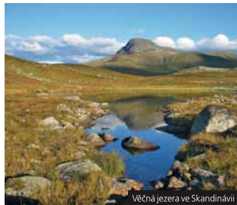
Věčná jezera ve Skandinávii