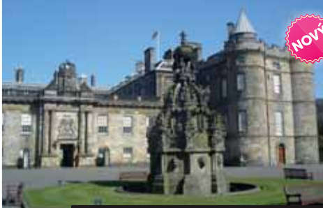
Kamenné stavby Skotska jsou symbolem země