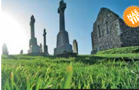
Kamenná romantika, jaká se vidí jen v Irsku