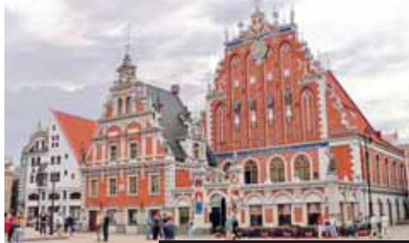
Dům Černoahlavců v Rize (Lotyšsko)

1. den: odlet v poledne do Petrohradu, transfer do hotelu, ubytování, individuální volno 2. den: PETROHRAD – ☉, celodenní prohlídka, Zimní palác, křížník Aurora, Ermitáž , a exklusivně návštěva briliantové klenotnice s korunovačními klenoty ruských carů (běžně nepřístupná), lodí po Něvě, Petropavlovská pevnost, katedrála sv. Petra a Pavla s hrobkou Petra Velikého, 3. den: PETRODVORCE, letní rezidence Petra Velikého , velkolepý palác s parkem, zastávka u carského sídla v GATČINĚ , dar Kateřiny II. jejímu milenci knížeti Orlovovi, večerní jízda Petrohradem, otvírání mostů na Něvě 4. den: PETROHRAD, Jusopuvský palác , kde byl zavražděn Rasputin, nejlepší ukáзка šlechtických interiérů, Michajlovský palác, Ruské muzeum, Něvský prospekt, fakult. návštěva představení v Alexandrijském divadle 5. den: v noci fakult. otvírání mostů na Něvě, PUŠKIN (Carskoje Selo), město s paláci a parky, unikátní barokní palác Kateřiny I. Veliké s Jantarovou komnatou 6. den: PETROHRAD, dokončení prohlídky, odlet do Prahy Cena zahrnuje leteckou dopravu Praha-Petrohrad-Praha, letištní taxy 2.900 Kč, transfery z/na letiště, dopravu busem na výlety Petrodvorce a Puškin, 5x hotel (2lůžk. pokoje), 5x snídaně, průvodce, komplex. pojištění (možnost připojištění vyššího storna); nezahrnuje vízum, vstupné a fakult. akce. Příplatek 2.500 Kč 5x večere. Příplatek cca 1.450 Kč za vízum do Ruska (fakultativně).