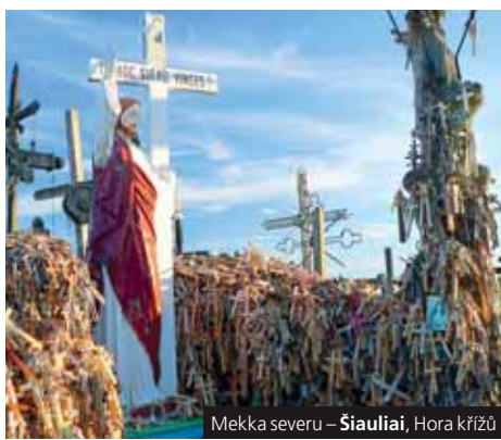
Mekka severu – Šiauliai, Hora křížů