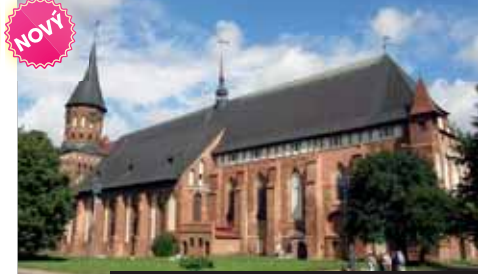
Cihlové katedrály jsou pro Kaliningrad typické