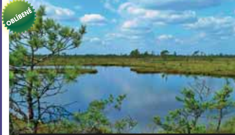
Nejnámější přímořský národní park Estonska u Tallinnu