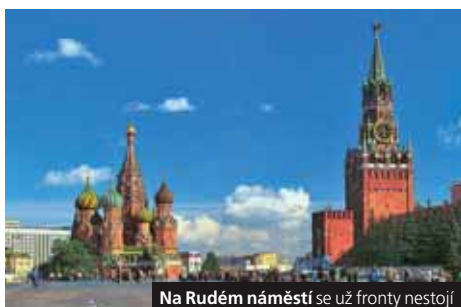
Na Rudém náměstí se už fronty nestojí