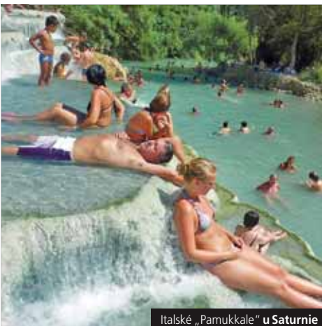
Italské „Pamukkale“ u Saturnie