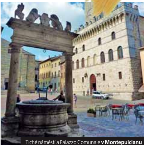
Tiché náměstí a Palazzo Comunale v Montepulciano