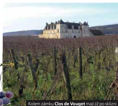
Kolem zámku Clos de Vougeot mají již po sklizni