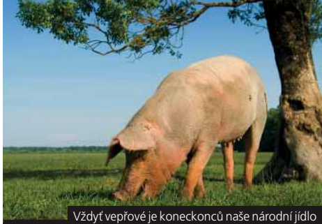
Vždyť vepřové je koneckonců naše národní jídlo