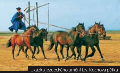
Ukázka jezdeckého umění tzv. Kochova pětka