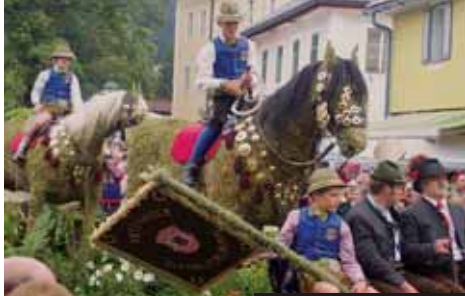
Festival sena v Lammertalu