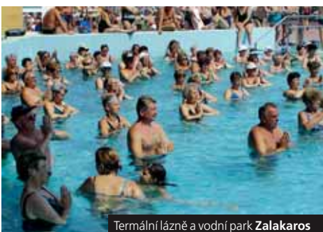
Termální lázně a vodní park Zalakaros