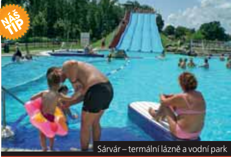
Sárvár – termální lázně a vodní park