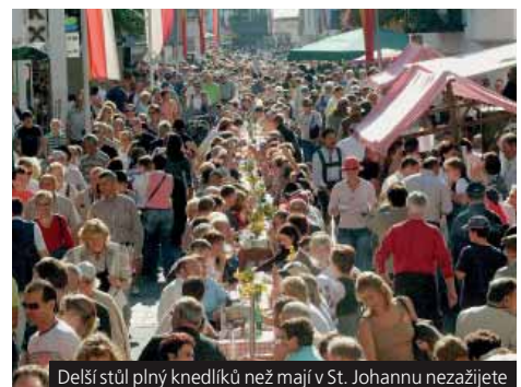
Delší stůl plný knedlíků než mají v St. Johannu nezažijete

Příplatek 500 Kč za 1lůž. pokoj, 370 Kč za 1x večeři.