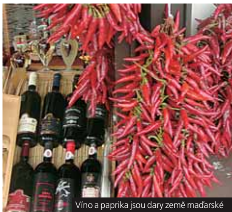
Víno a paprika jsou dary země maďarské

Lázně: Bükfürdő , moderní lázně Maďarska, 14 bazénů, pramen 58 °C s vysokým obsahem železa, nemoci pohybového ústrojí; Zalakaros , moderní lázeňské centrum, venkovní, vnitřní bazény, termály (až 96 °C) s vysokým obsahem jódu a minerálů (rehabilitace kloubů); Hévíz , přírodní termální jezero v sopečném kráteru (34 °C).