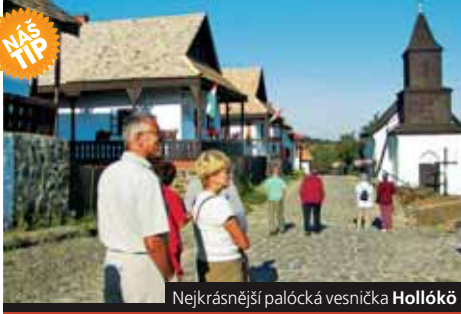
Nejkrásnější palocká vesnička Hollókő