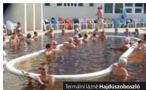
Termální lázně Hajdúszoboszló