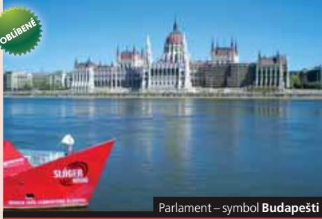
Parlament – symbol Budapešti