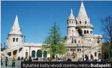
Rybářské bašty vévodí starému městu Budapešti

Skanzen Szentendre je centrem lidové kultury Maďarska právě na Velikonoce. Využijte svátky, ušetříte dovolenou. 1. den: odjezd z Prahy ve 23 h (HK, Pa, Br, svoz od 6 osob: HK, Pa za 300 Kč), transfer přes Bratislavu do Maďarska 2. den: BUDAPEŠT, Pest , tržnice – ráj gastronomických suvenýrů, slavnostní atmosféra velikonočních trhů, veselice, fakultativně koupel v termálních lázních Széchenyi , Városliget, projížďka městem, ubytování a večere 3. den: BUDAPEŠT , římské město Aquincum, Buda: okružní jízda městem, hradní čtvrť (Rybářská bašta, Matyášův chrám, palác), fakultativně pravá maďarská palačinka, koupání v luxusních termálních lázních hotelu Gellért , večere v hradní restauraci, vyhlídka z vrchu Gellért na osvětlenou Budapešť možná i s cimbálovou čardášovou hudbou 4. den: slavnostní Velikonoce v SZENTENDRE , památky jihoslovenské kultury a skanzen lidové architektury, gastronomie, tradice a folklór Velikonoc, zastávka OSTŘIHOM , návrat před půlnocí Cena zahrnuje dopravu autobusem, 2x hotel, 2x polopenzi, průvodce; nezahrnuje komplexní pojištění, vstupné a lázně (doporučujeme 40 €). Příplatek 800 Kč za 1lůžkový pokoj. Příplatek 112 Kč za komplexní pojištění. Cena od 4.590 Kč pro kolektiv 40 osob. Pro kolektivy možné prodloužení zájezdu o celodenní pobyt v Szentendre fakult. večere na rozloženou v csardě a s návratem do Prahy časné ráno.