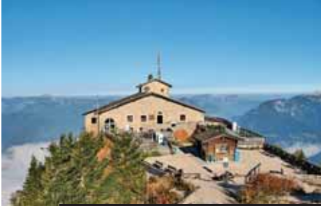
Do čajovny Kehlsteinhaus Hitler skoro nezavítal