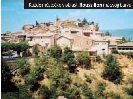
Každé městečko v oblasti Roussillon má svoji barvu