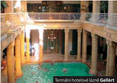
Termální hotelové lázně Gellért