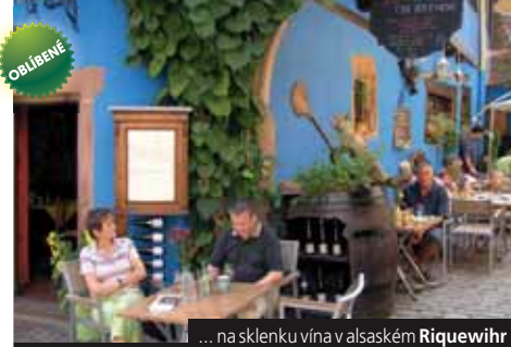
... na sklenku vína v alsaském Riquewihr