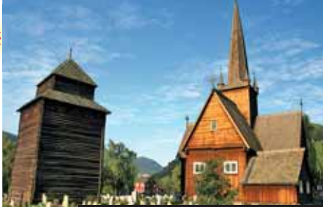
Dřevěné kostelíky zdobí skandinávské země