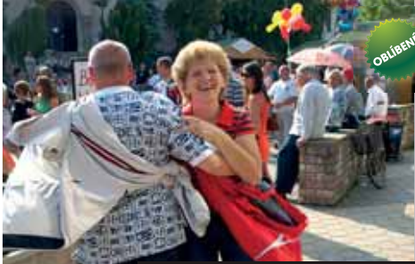
Oslavte vinobraní maďarským čardášem