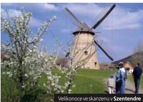
Velikonoce ve skanzenu v Szentendre

Lázně: Sárvár , moderní areály s krytými i venkovními termálními bazény a animačními programy; 38 °C; Mosonmagyaróvár s alkalickou, hydrogen-uhlíkatou vodou, 74 °C, (chronické záněty kloubů, úbytek vápníku v kostech, gynekologické obtíže), inhalace i pitná kúra; přírodní termální jezero v sopečném kráteru (34 °C).