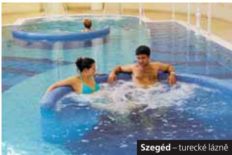
Szegéd – turecké lázně

Lázně: Egerszalók , rekreační areál u přírodních termálů s travertinovým svahem, voda až 60 °C; Déjmen , malé, ale příjemné termální lázně Eger: lázeňský areál přímo v centru města, popis viz. B1. Miskolc-Tapolca , moderně zrenovované původní jeskynní termály s lázeňským parkem, voda 32–36 °C s minerály, viz B4.