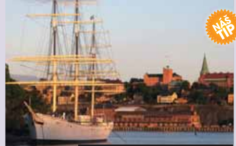
Stockholm, vůně moře a sláného větru

1. den: odjezd z Prahy večer 2. den: Mons Klint, 100 m vysoké křídové útesy, staré kolem 70 mil.let v délce asi 7 km, KODANĚ , královský palác Amalienborg , Christianborg, velkolepá radnice, možnost okružní plavby přístavem, Malá mořská víla 3. den: Frederiksborg Slot , velkolepý královský zámek s nádhernými exteriéry, interiéry i zahradami, Rytterský sál, Audienční síň, zámecká kaple, Kronborg Slot – 4. Hamletův „hrad Elsinor“ , Velký sál, Králova komnata, kobky se sochou vikingského náčelníka Holgera Dánského, HELINGSØR , na břehu průlivu mezi Severním a Baltským mořem 4. den: ROSKILDE , bývalé hlavní město Dánska, katedrála – 5. Egeskov Slot , jeden z nejkrásnějších vodních zámků 5. den: návrat ráno Cena zahrnuje dopravu autobusem, 2x hotel, 2x snídaní, průvodce, komplexní pojištění; nezahrnuje vstupné, jízdu lodí v Kodani a fakultativní akce.