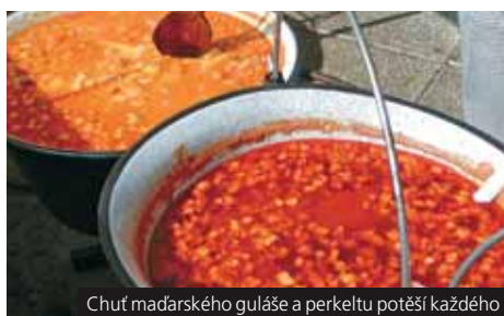
Chut maďarského guláše a perkelty potěší každého