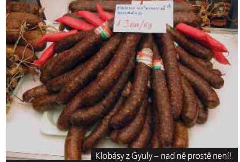
Klobásy z Gyuly – nad ně prostě není!