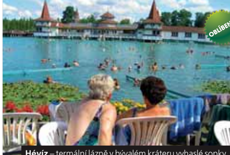
Hévíz – termální lázně v bývalém kráteru vyhaslé sopky