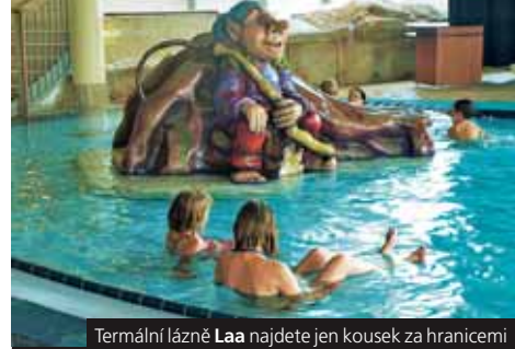
Termální lázně Laa najdete jen kousek za hranicemi