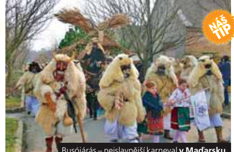
Busójárás – nejslavnější karneval v Maďarsku