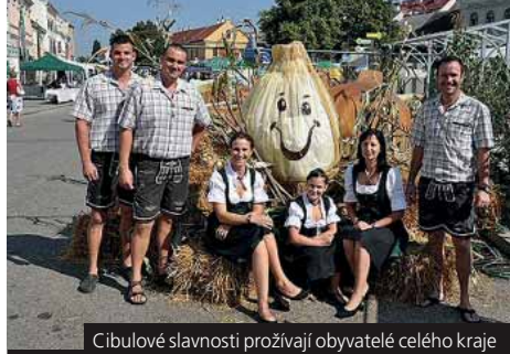
Cibulové slavnosti prožívají obyvatelé celého kraje