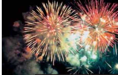
Světelné show a ohnivé obrazce na horách