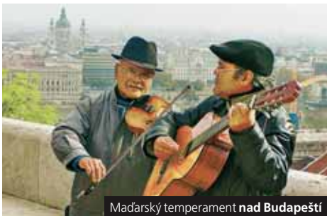
Maďarský temperament nad Budapeští