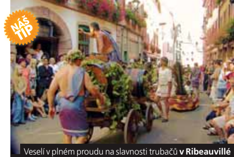
Veselí v plném proudu na slavnosti trubačů v Ribeauvillé