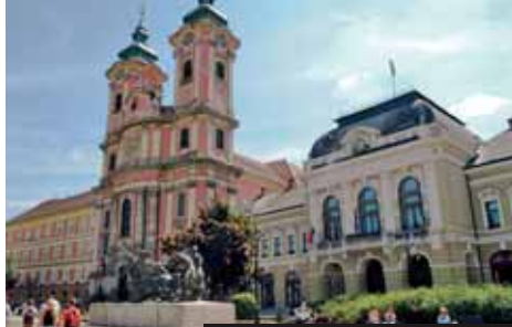
Eger, kostel od K. I. Dientzenhofera