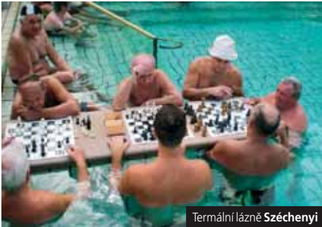
Termální lázně Széchenyi

Lázně: Bükfürdő , moderní lázně Maďarska, 14 bazénů, voda 58 °C s obsahem železa, léčba poruch pohybového ústrojí; Sárvár moderní areály s krytými a venkovními bazény, skluzavkami, léčivými termály; Győr , městské termály s příjemným wellness.