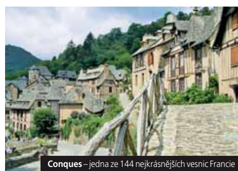
Conques – jedna ze 144 nejkrásnějších vesnic Francie