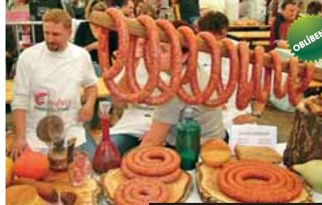
Slavnosti klobás v Békéscsábě