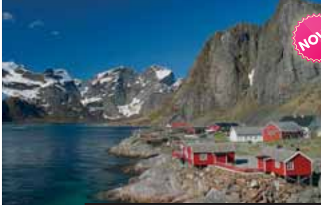
Romantika fjordů a rybářských osad Norska