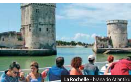
La Rochelle – brána do Atlantiku

Příplatek 196 Kč za komplexní pojištění.