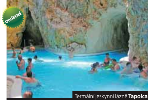
Termální jeskynní lázně Tapolca

Termální lázně pro zájezdy B1 a B2: Eger , městské termální lázně s parkem, krytá i venkovní část (voda 32–38 °C, léčba pohybového ústrojí); Hajdúszoboszló , obrovský lázeňský park, voda až 38 °C s obsahem jódu a sloučenin síry (pohybové ústrojí, gynekologické a kožní potíže); zážitkové hotelové lázně s léčivou vodou jako veřejné; Miskolc Tapolca , moderní jeskynní termály s masážními proudy i s venkovními bazény, voda 32–36 °C; Széchenyi , secesní městské termály v centru Budapešti s plaveckým bazénem, saunami a perličkami; Egerszalók , rekreační areál u přírodních termálů s travertinovým svahem, voda až 60 °C; Sóstófürdő , termální lázně a aquapark u Nyíregyházy, termální bazén 34–36 °C, plavecký bazén, sauna, skluzavky.