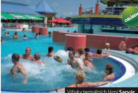
Vířivky termálních lázní Sárvár