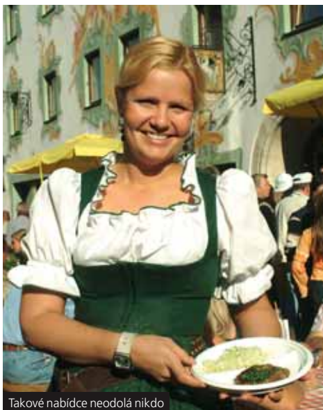
Takové nabídce neodolá nikdo