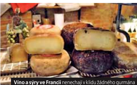
Víno a sýry ve Francii nenechají v klidu žádného gurmána