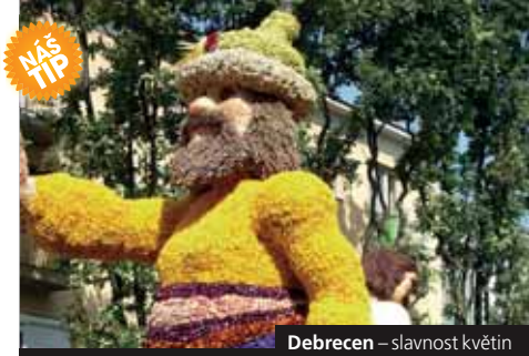
Debrecen – slavnost květin