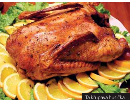
Ta křupavá husička...