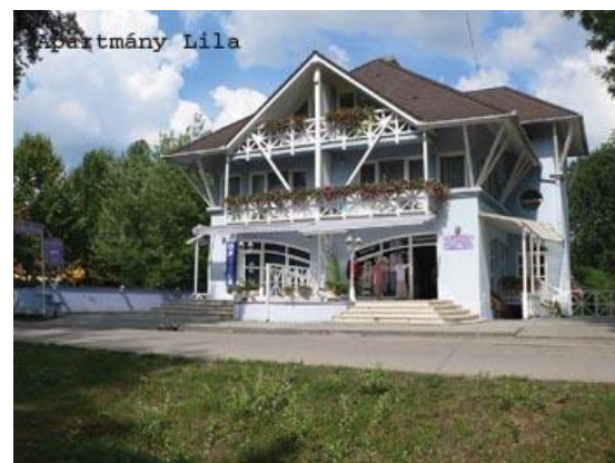
Cenník pro penzion forrás

Stravování: V ceně pobytu není strava, apartmány jsou pro vaření dostatečně vybavené. Klienti si mohou za příplatek přibjedenat snídaně i večere (viz příplatky pod tabulkou), které se podávají v restauraci penzionu Forrás. Snídaně se podávají formou bufetu a večere formou výběru z několika menu o 3 chodech.