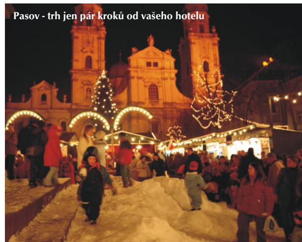
Pasov - trh jen pár kroků od vašeho hotelu